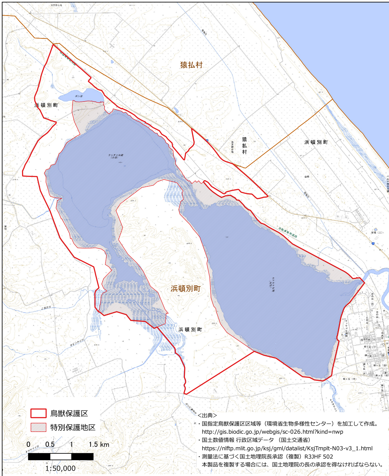
国指定浜頓別クッチャ口湖鳥獣保護区 区域図