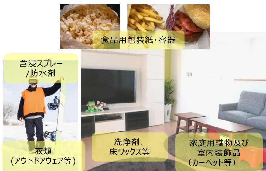
21 図 5-1 居住住居室内及び身の回りの製品における PFHxS 含有製品イメージ

1 2 3-2 の含有製品と濃度の確認において、PFHxS を含有する製品種、検出率及び含有濃 3 度は大部分が検出下限値未満又は数 ng/g 以下の低濃度であった。したがって、本リス 4 ク評価で着目する暴露源となる製品群としては、室内で多くの面積を占有し、接触頻度 5 及び接触面積が大きいと考えられるカーペットを主たるものとし、居住住宅の室内空気 6 及びダストに関しては国内外のモニタリング情報を参考として、暴露評価を行うことと 7 する。