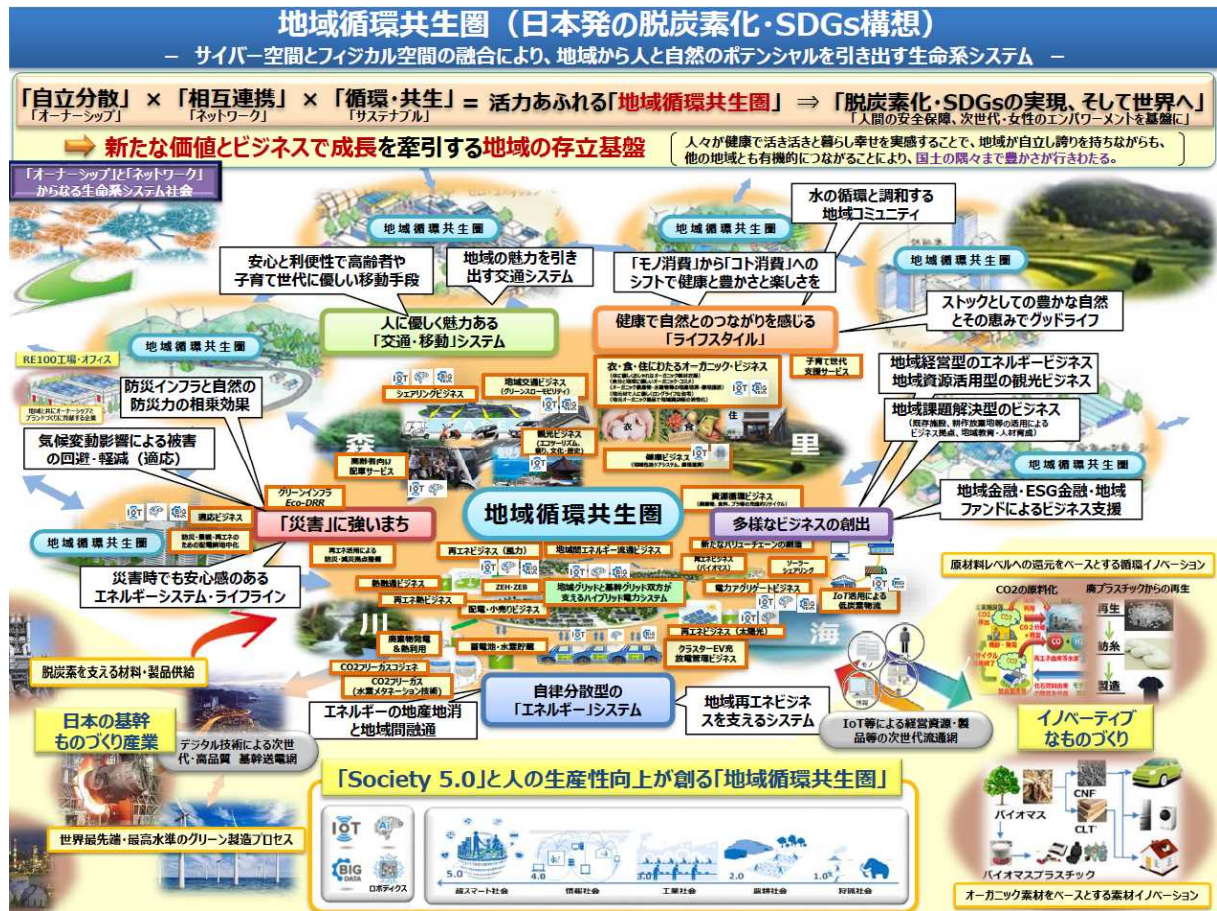
参考資料 3 .地域循環共生圏(日本発の脱炭素 地域循環共生圏(日本発の脱炭素化・SDGs構想) (2018年12月25日中央環境審議会総合政策部会資料)