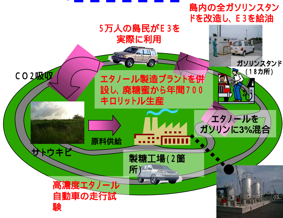
<宮古島「バイオエタノール・アイランド」構想>