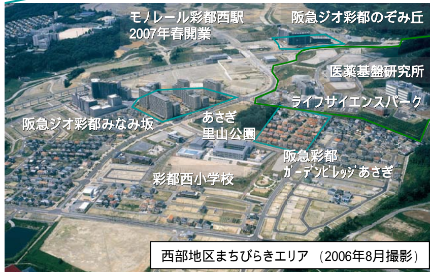
西部地区まちびらきエリア (2006年8月撮影)