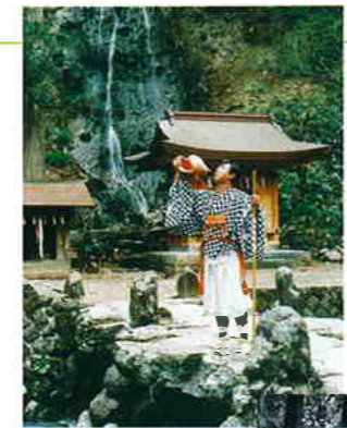
毎年12月、市内の至る所で法螺貝を吹く山伏に会える

羽黒山で大晦日から元旦にかけて繰り広げられる「松例祭」。その浄財集めのために行われる伝統行事が「松の勸進」である。毎年12月、山伏たちが法螺貝の音を響かせ、家内安全などを祈りながら各家庭をまわり歩く。