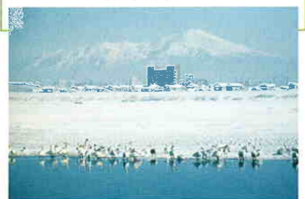
最上川河口には毎年多くの白鳥が飛来する

毎年10月に飛来する白鳥の声は冬の訪れを感じさせ、春の北帰行までの間、朝夕の餌付けのとき、求愛や飛行のときなど、さまざまな鳴き声が聞かれる。市民が身近に白鳥とふれ合える場所であり、愛護活動も盛ん。