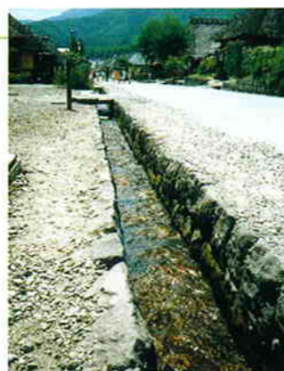
清冽な流れの大内宿の用水路