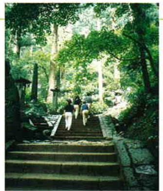
夏、蟬しぐれのなか、山門をくぐると、千以上の石段が奥の院如法堂までつづく

蟬の声に対する日本人特有の感性を示すといわれる芭蕉の名句「閑さや岩にしみいる蟬の声」の舞台、立石寺(山寺)。毎年7月から8月にかけて無数の蟬の声がひとつになって深山から響く。