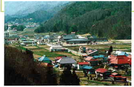
のどかな山里に機織りの音が響く