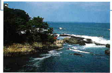
五浦の岬の先端に立つ、岡倉天心が患病の場とした朱塗りの六角堂 (写真/萩尾昇)