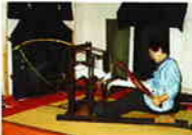
技術も伝えていきたいからむし織

「カラカラ」「トントン」という機織りの音が、四季折々の景色のなかで古代布「からむし織」の里に静かに響く。本州唯一のからむし栽培地として600年余の歴史を伝える音風景である。