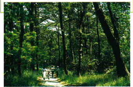
風の松原では自由に散策コースをとれる

能代市域の日本海沿いの大規模な海岸林は「風の松原」と呼ばれ、先人から引き継いだ市民の貴重な財産である。その天空にそよぐ風は、黒松の針葉をくぐり抜けて「松籟」となり、松濤をよびおこす。また、ここは、「かおり風景100選」など6つの日本100選に認定され、緑豊かな自然環境は、市民に懐かしい日常生活を忘れさせる、憩いの場、安らぎの場を与えている。