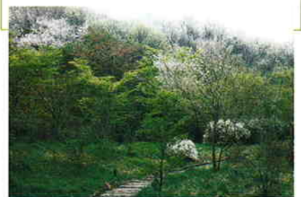
静かな小鳥の森では鳥の声がよく響く