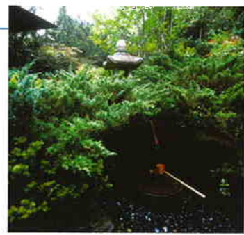
庭園の景色に溶け込む水琴窟

手を洗った水が穴から滴となって落ち、琴のような音を出すように工夫された水琴窟。高崎芸術短期大学・高崎保育専門学校構内の約4000坪の日本庭園「水琴亭」の中にあり、地域に開放され、多くの人が訪れる。