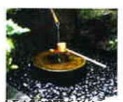
蹲居からあふれた水が地中の壺に落ちて共鳴する

手を洗った水が穴から滴となって落ち、琴のような音を出すように工夫された水琴窟。高崎芸術短期大学・高崎保育専門学校構内の約4000坪の日本庭園「水琴亭」の中にあり、地域に開放され、多くの人が訪れる。