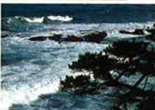
太平洋の荒波が断崖や岩礁に砕け散って激しい音をたてる

5つの入江をもつことから「五浦」と呼ばれる五浦海岸。波の浸食により複雑に削り取られた崖や岩礁から、太平洋の荒波が聞こえる。風光明媚な地で、海に突き出た断崖上には岡倉天心の六角堂がある。