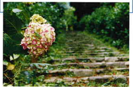
梅雨のころは、美しいあじさいはもちろん、雨蛙の姿も見られる

栃木市街地に接した太平山には、うっそうとした森の中に約1000段の石段の参道がある。6月から7月の梅雨のころ、この参道沿いに色とりどりの紫陽花が咲き、雨のしたたるあじさい坂に蛙の鳴き声が響く。