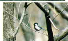
「ツブー、ツブー」と鳴くシジュウカラ

福島市街地近くにある小鳥の森は、年間を通じて野鳥が多く、とくに春から初夏にかけてはシジュウカラ、クロツグミ、サンコウチョウなどの声を楽しめる。ネイチャーセンターでは、専任レンジャーによる野鳥や自然の解説を受けることができる。