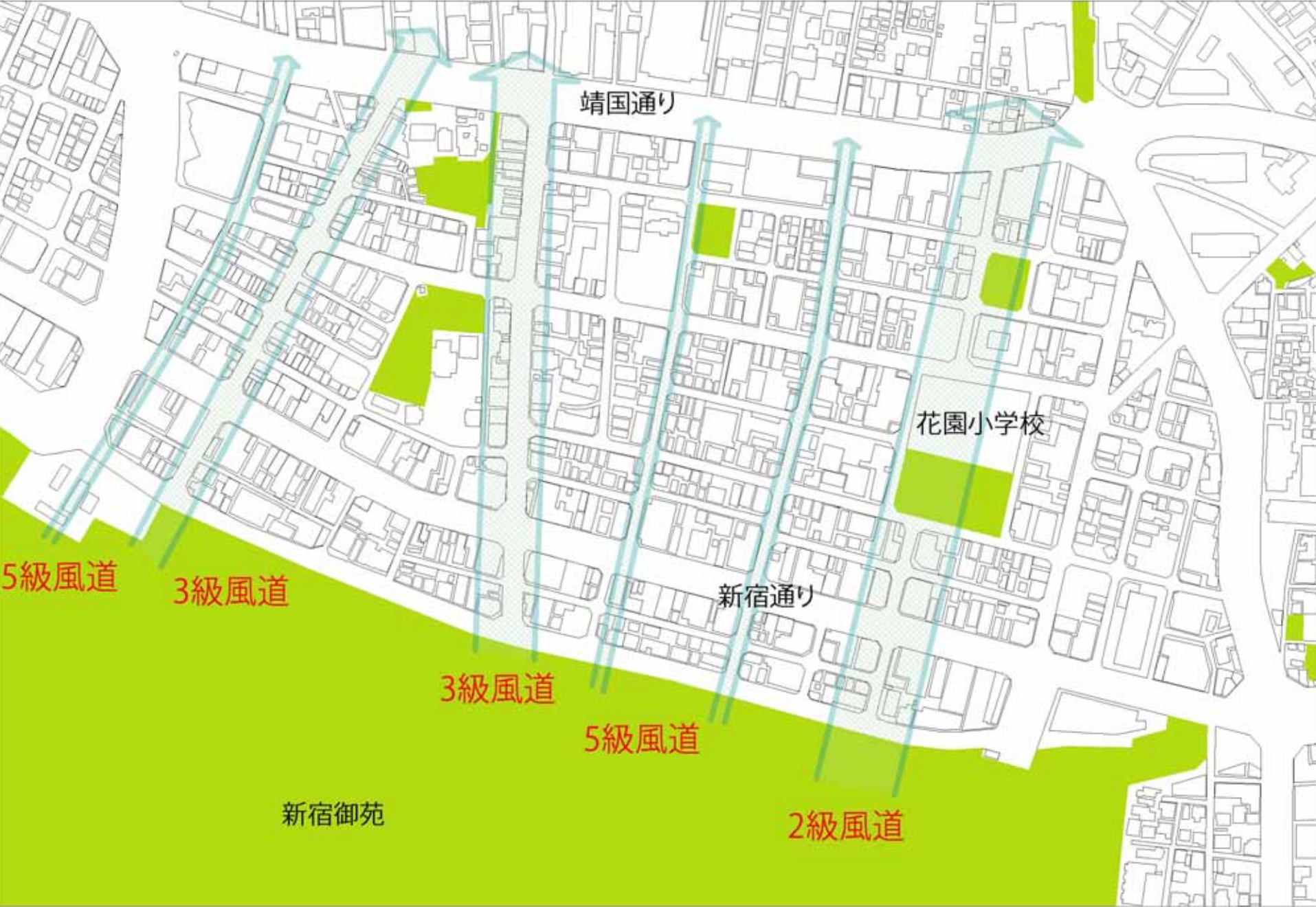
風の道となる軸線の設定