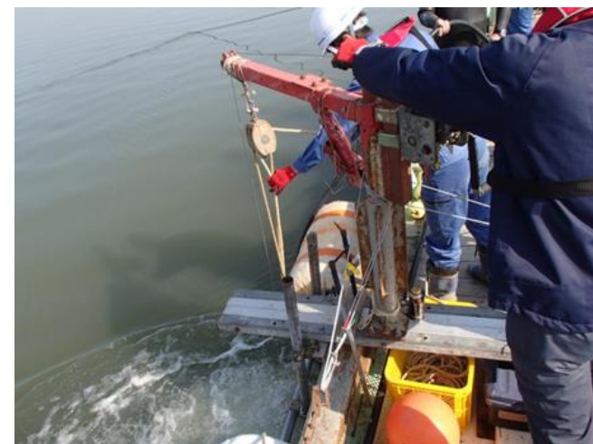
河床堆積構造調査（コアサンプリング）状況