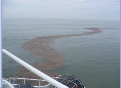
海面上に集まる漂流ごみ