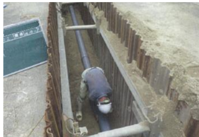
下水道管渠の布設（整備）状況