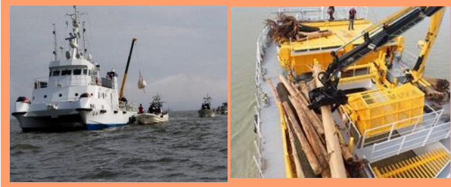
「令和2年7月豪雨」での対応状況