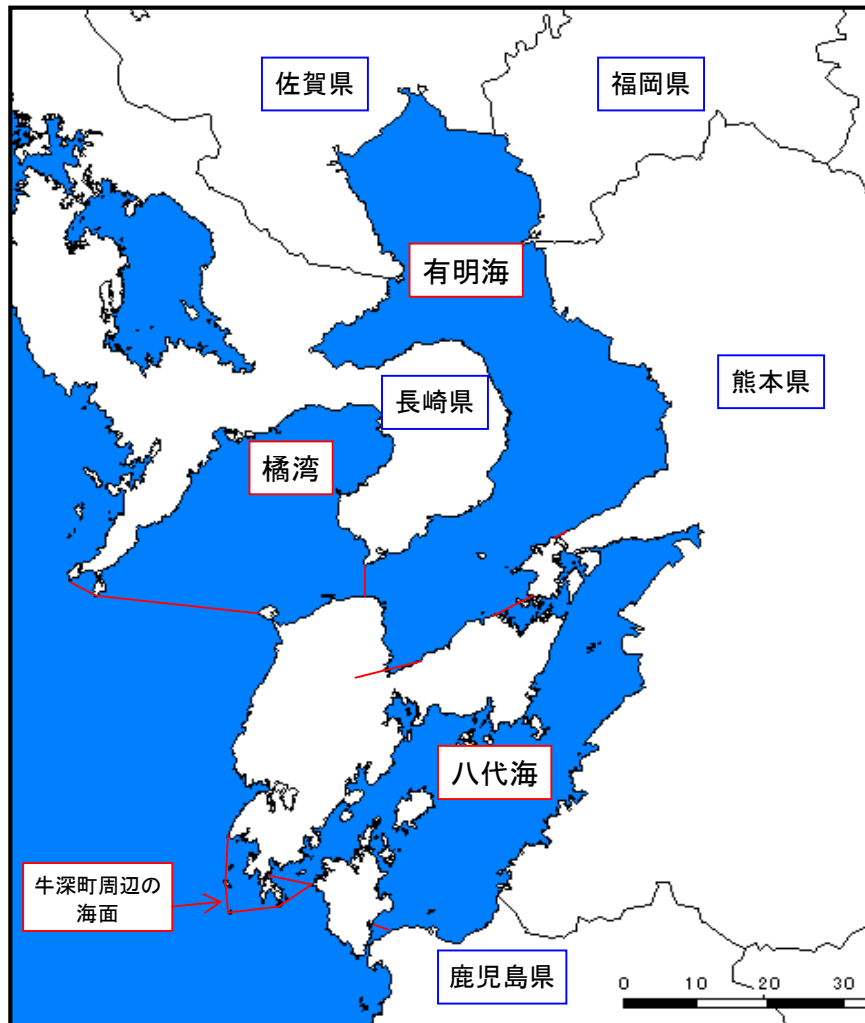
図 2. 1. 1 有明海・八代海等の位置

※第4回自然環境保全基礎調査（1990）より、熊本県では、天草下島の西～南岸と御所浦島周辺にイシサンゴの棲息が知られていて、有明海南部での棲息が示唆されている（熊本県1978）が、実際のデータの集計は天草下島最南西部に位置する牛深市周辺のみで行なわれている。