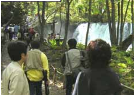
歩道の利用の様子