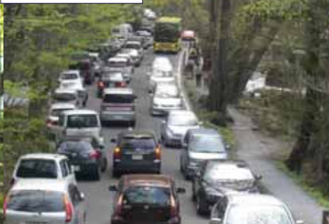
車道の渋滞の様子