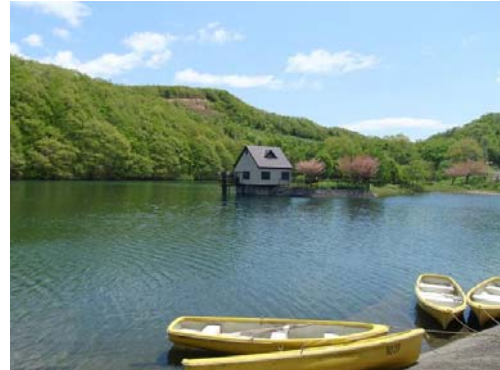
硯石・長老湖 長老湖畔