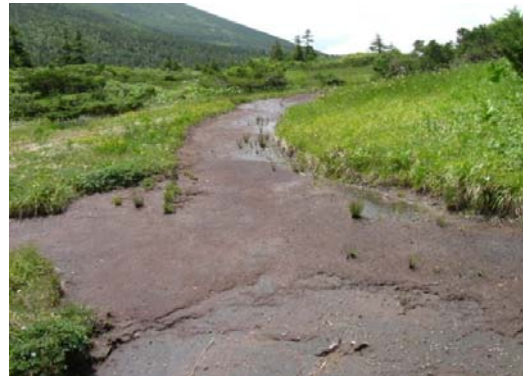
芝草平 裸地化箇所