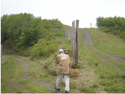
見返峠瀧山線 左手が歩道