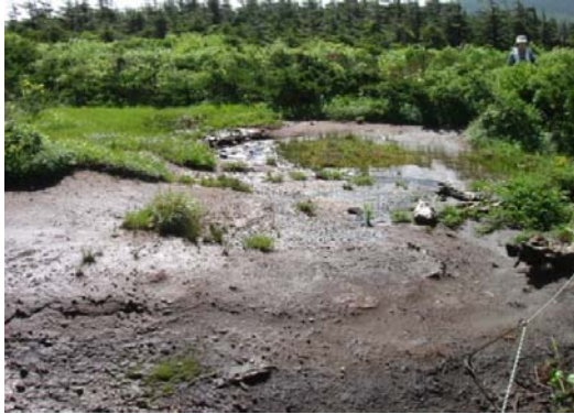
芝草平 裸地化箇所