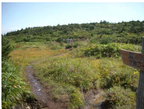
お清水刈田線 蔵王エコーライン付近