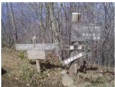
無秩序に整備された道標