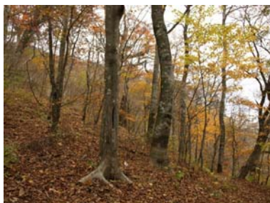
三頭山山頂付近のブナ林