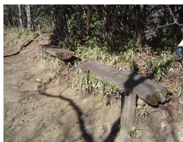
老朽化したベンチ