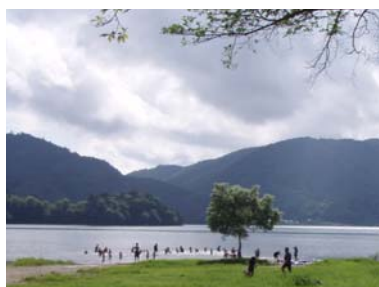
湖岸での水遊び(早稲沢)