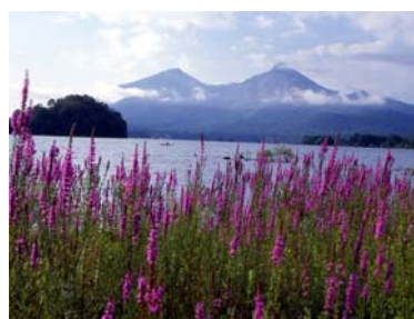
エゾミソハギの群生地(細野)