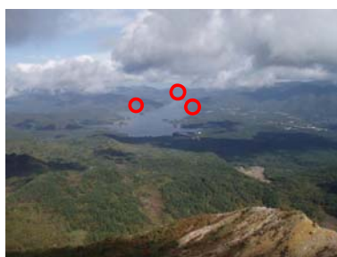
磐梯山から見た絵原湖