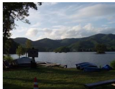
キャンプ場から見た曾原湖(狐鷹森)