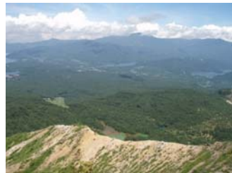
磐梯山からの遠景