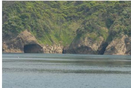
多古鼻(多古の七ツ穴)