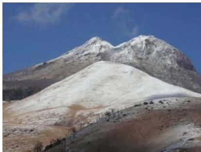
事業予定地から由布岳の眺望