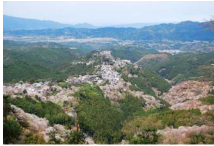
吉野山展望(世尊寺跡の展望台)