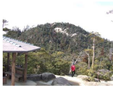
獅子岩駅舎から見た弥山