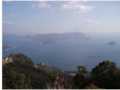
展望台から見た瀬戸内海