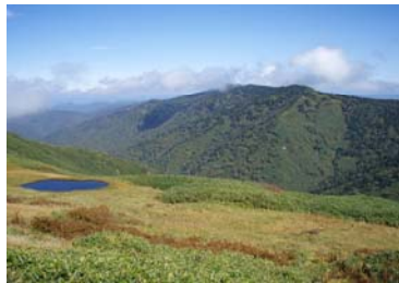
会津駒ヶ岳～中門岳間の展望