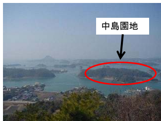
高舞登山から見た中島園地