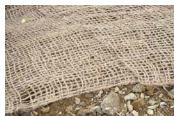
試験で使用了緑化ネット