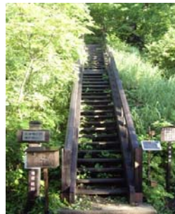
会津駒ヶ岳滝沢登山口(事業歩道起点)