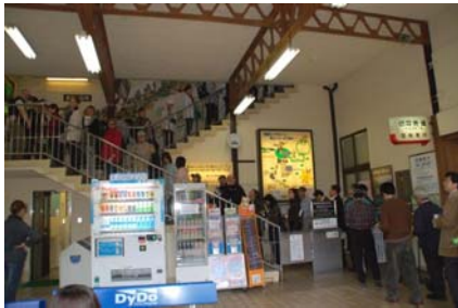
ロープウェイ待ちの観光客