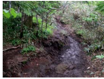
田代山から帝釈山への登山道