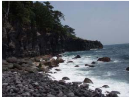
城ヶ崎海岸の風景