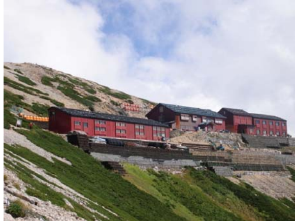
北側から見た宿舎