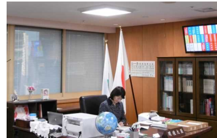
今年3月に環境大臣室にLED照明を導入