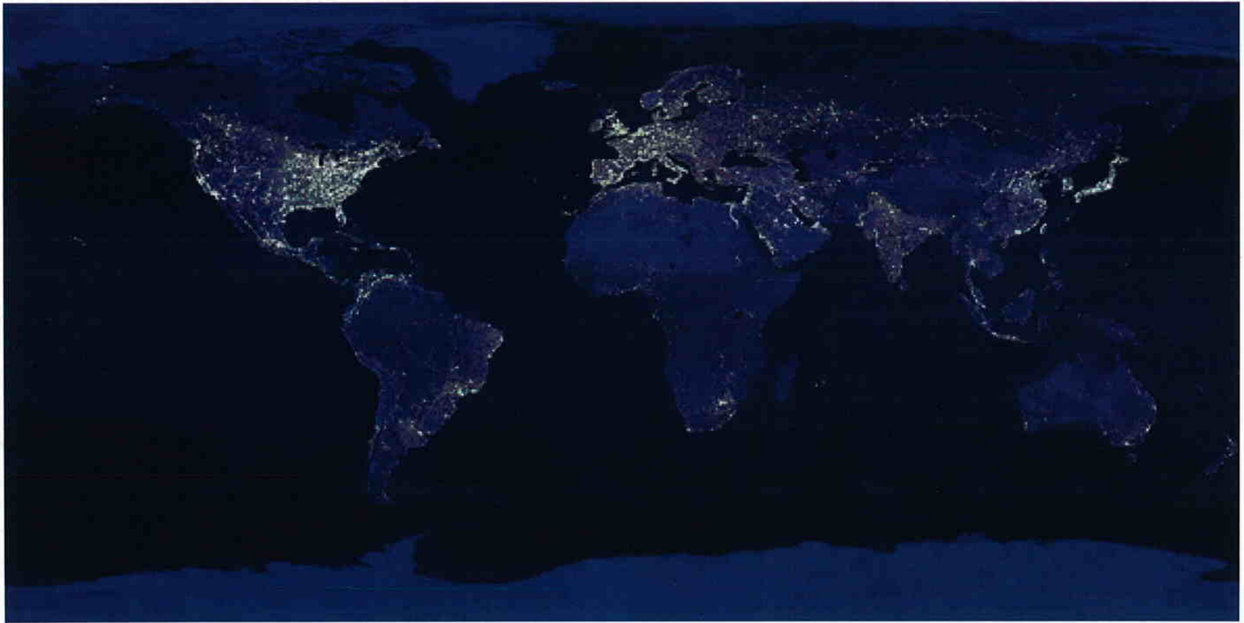
夜半球の地球(NASA画像)