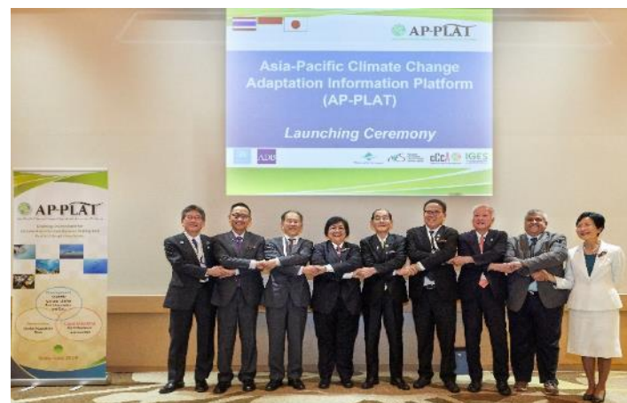
AP-PLAT立ち上げ式(長野県軽井沢)

G20会合期間中に立ち上げ。影響予測などの科学的知見をアジア太平洋各国に提供する情報基盤(ウェブサイト)。