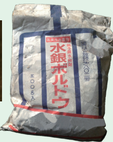
(参考一例) 水銀ボルドウ