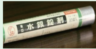
(参考一例) 水銀錠剤

水銀含有農薬には、大きく、紙袋入りの「いもち病対策」と、錠剤の「種子消毒・土壌殺菌用」があります。昭和48年に使用が禁止されましたが、現在でも毎年水銀含有農薬が処理されている実績があり、その多くは大掃除などの機会に排出されています。