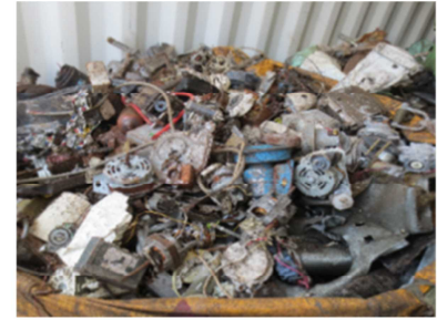
シップバック通報を受けた雑品スクラップ