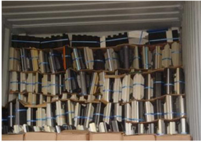
シップバックされた液晶ディスプレイ