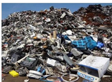
雑品スクラップの例

規制対象物は告示で規定されているが、バーゼル法に制定の根拠がないため、混合物を含め具体的な特定有害廃棄物等の範囲を明確な法的根拠に基づいて定めることができるようにする方策を検討すべきではないか。