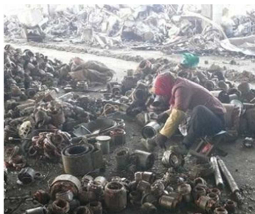
中国での金属スクラップ手解体 (2010年 国立環境研究所 寺園淳氏撮影)