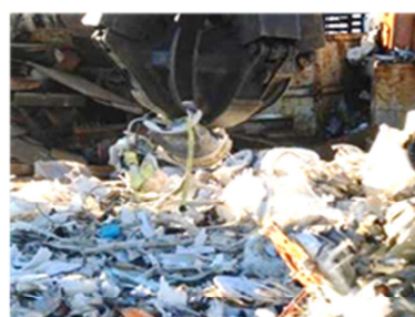
重機による洗濯機の破碎