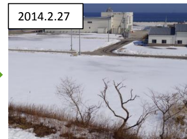
処理完了による仮置場解消事例【岩手県洋野町】