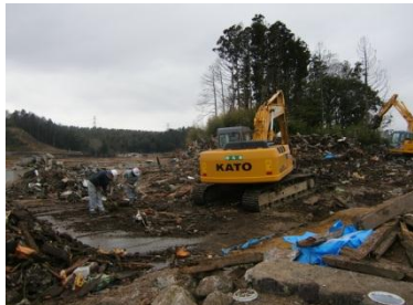
富岡町における津波がれきの撤去状況 (平成27年1月)

対策地域内廃棄物処理計画（平成25年12月26日一部改定）に基づき、帰還の妨げとなる廃棄物の撤去と仮置場への搬入を優先して、災害廃棄物等の処理を実施中。