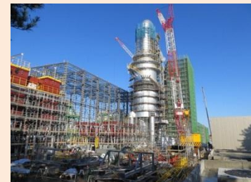
南相馬市における仮設焼却施設の建設状況 (平成27年1月)