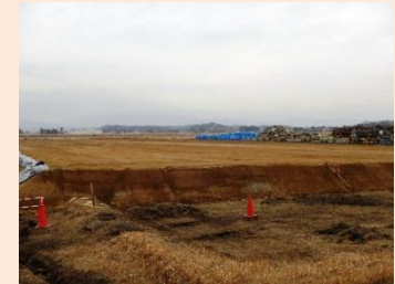
双葉町中野地区における仮置場の整備状況 (平成27年1月)