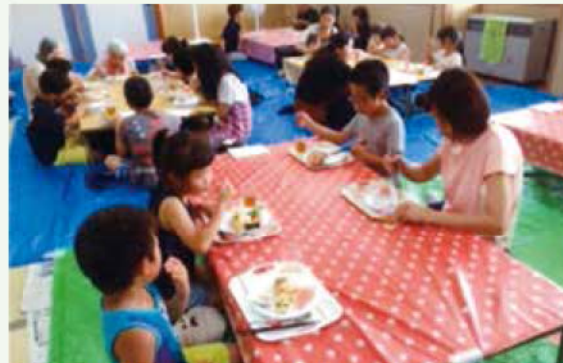
子ども食堂に取り組む生活学校もあります