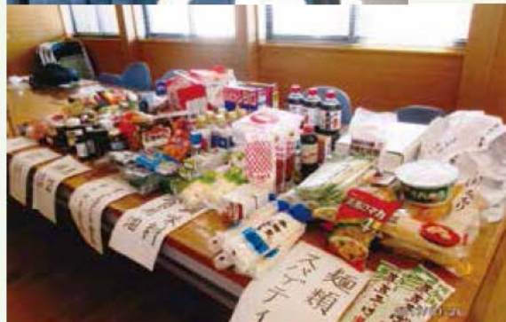
集めた食品を直接お届けしています