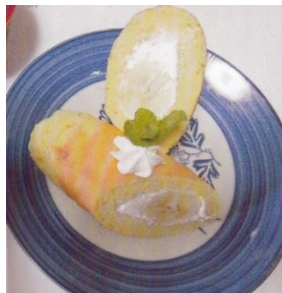
※残ったバナナを使用したレシピ（一例）