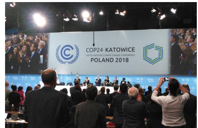
パリ協定実施指針の採択時