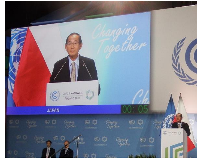
原田大臣の閣僚級ステートメント