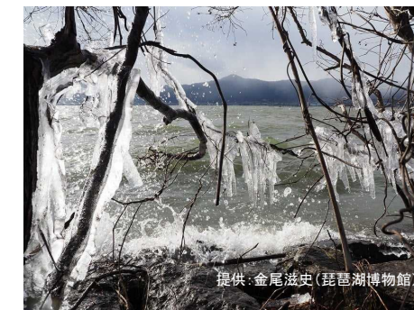
南湖湖岸のしぶき氷(2月)