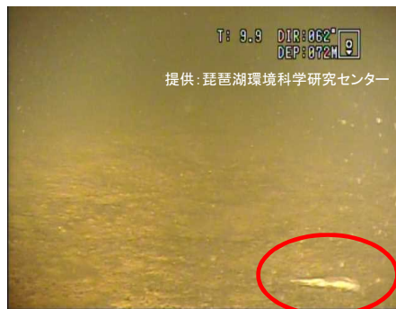
北湖湖底のイサザの死亡個体(12月)