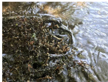
ホンモロコの産着卵(6月)

水草は昨年度に引き続き春は少ない量で推移しましたが、7月頃からクロモなどが増加し、10月にかけて広い範囲で繁茂しました。ここ数年は、越冬するセンニンモやコカナダモから、越冬しないクロモなどへの種の変遷が進んでいるようです。