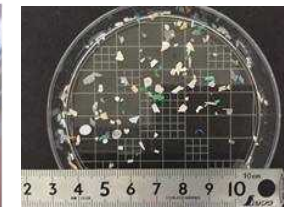
(左図) 洗顔料に含まれるマイクロビーズ (1次マイクロプラスチック) (右図) 微細なプラスチック片 (2次マイクロプラスチック)