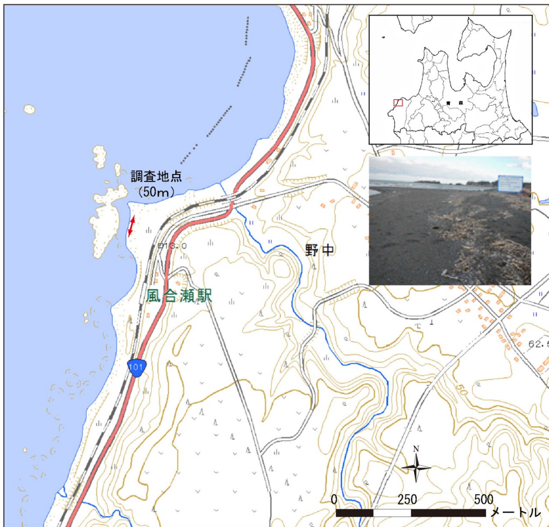
図 1.3-3 (3) 青森県深浦町風合瀬海岸の調査地点