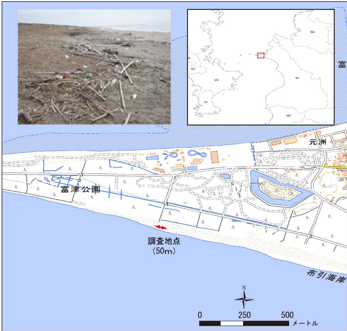
図 1.3-3 (5) 千葉県富津市布引海岸の調査地点