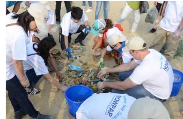
2015 Joint TEMM-NOWPAP ICC