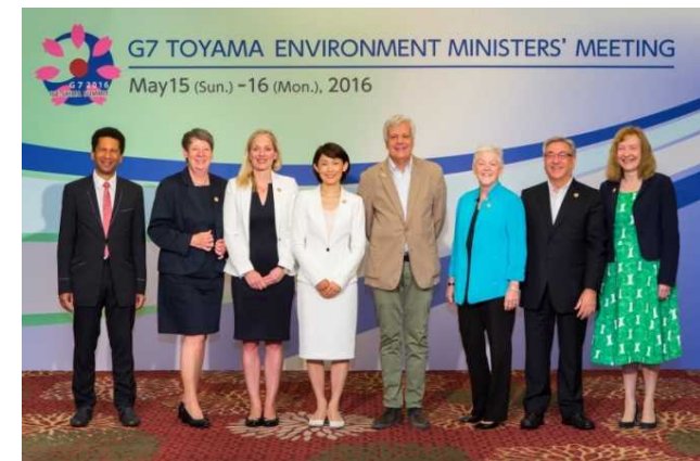
G7・富山環境大臣会合(平成28年5月)