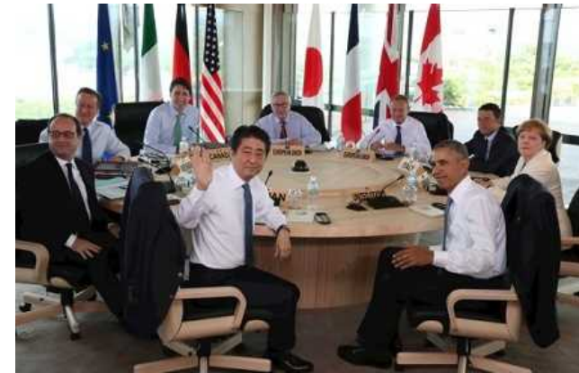
G7・伊勢志摩サミット(平成28年5月)