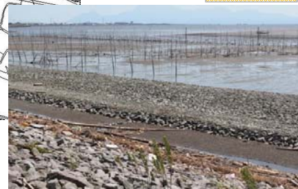
集積後、捨石部に新たな漂着発生