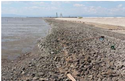
漂着状況（対象外区間）