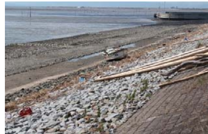
集積後、捨石部に新たな漂着発生