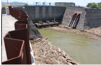
吹き寄せにより新たに漂着発生