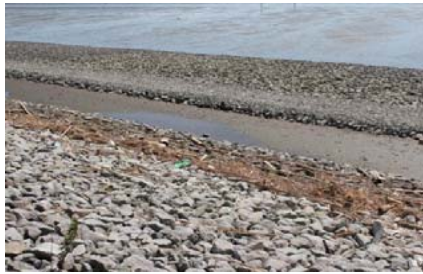
集積後、捨石部に新たな漂着発生