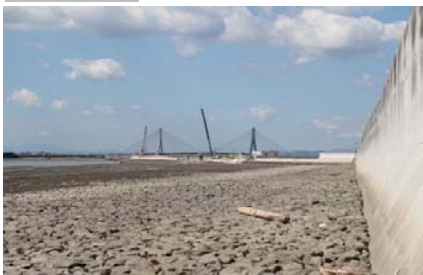
漂着状況（対象外区間）