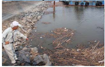
撤去後、新たに漂着発生