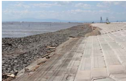
漂着状況（対象外区間）