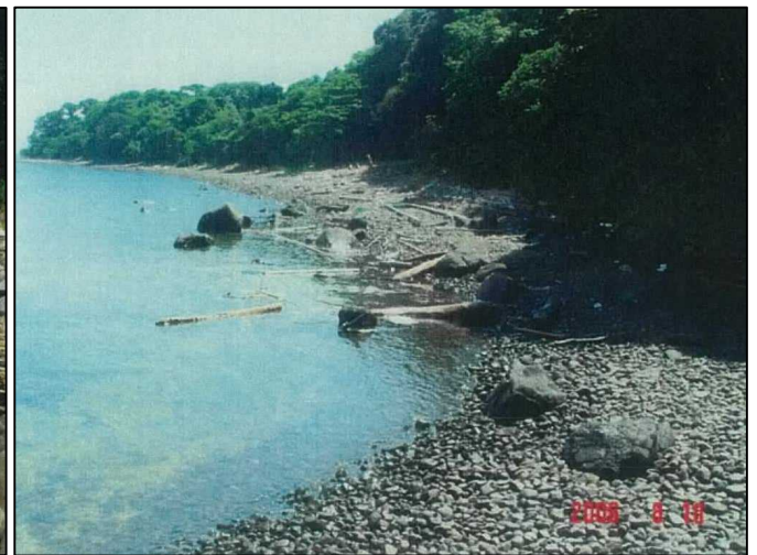
向島（内海（東側）海岸）の漂着状況