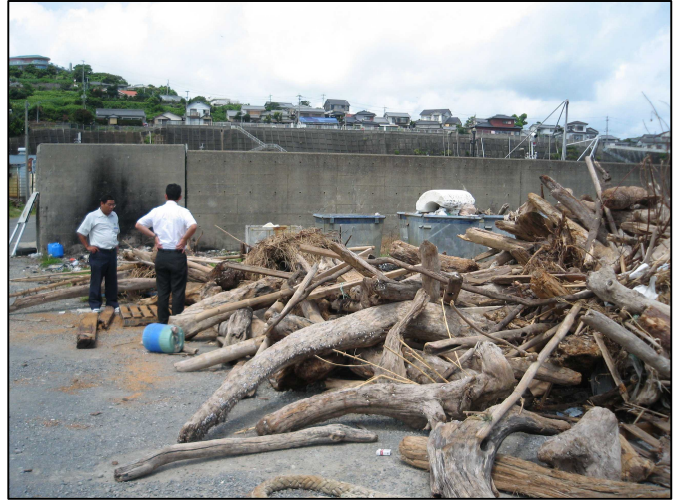
諫早市の一時保管場所となっている有喜漁港埋立地護岸