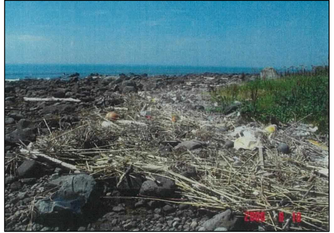
向島（外海（西側）海岸）の漂着状況