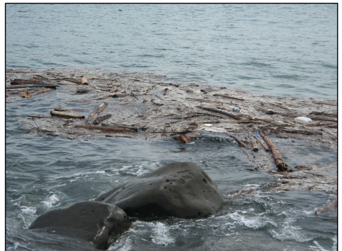
海岸前面で漂流・漂着する流木