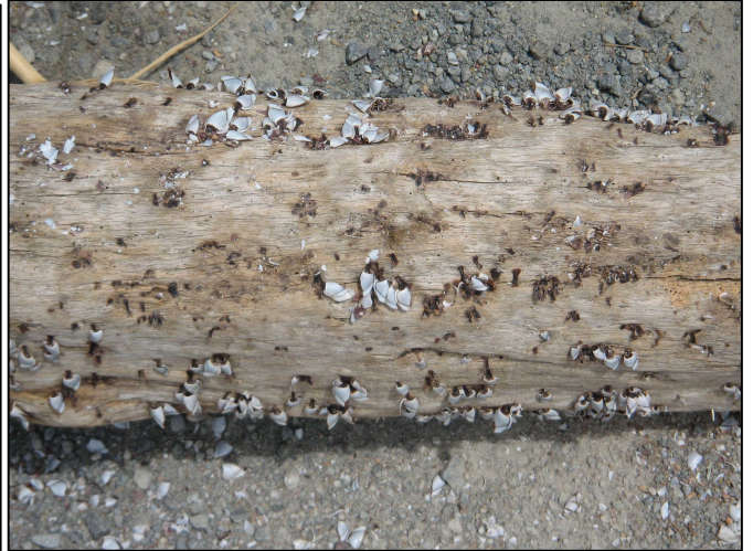
エボシガイが付着する樹木の根部分