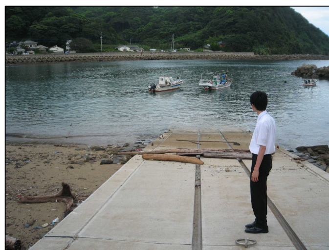
船上げ場に漂着した流木