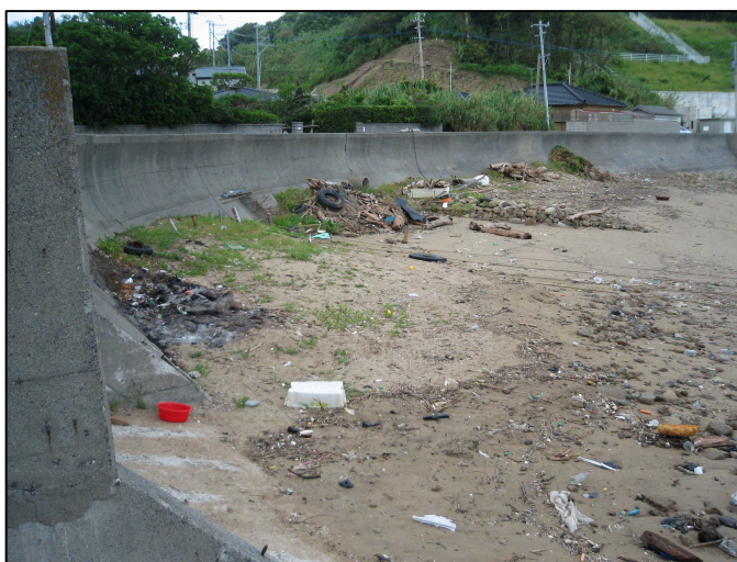
上げ潮時に護岸際まで打ち寄せられている状況