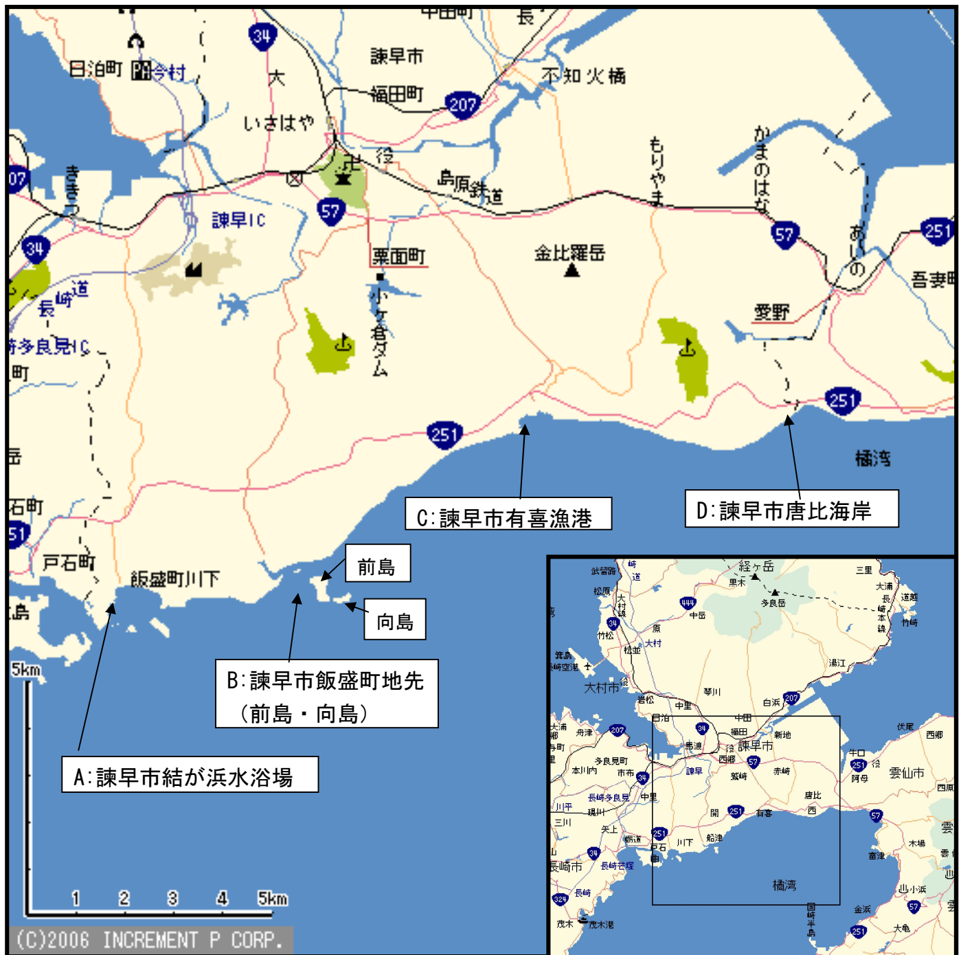
図1-4a 現地調査地点図（諫早市）

諫早市においては有喜漁港内埋立地に回収流木が保管されており、大小様々な流木が回収され、エボシガイが付着する流木も見られた。また、飯盛町地先、飯盛町前島・向島、唐比（からこ）海岸には大量の流木が漂着しており、特に、唐比海岸の前面には漂流・漂着する流木が大量に観察された。