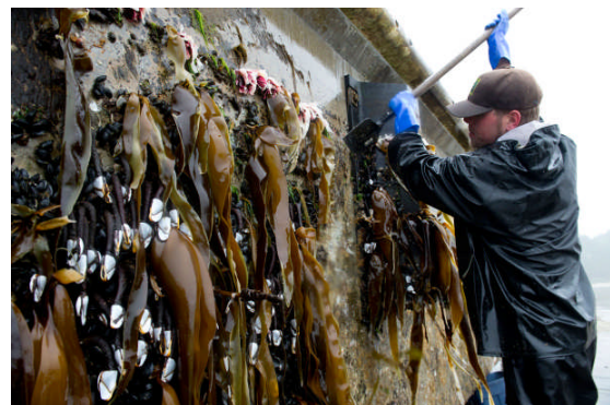
オレゴン州の海岸に漂着した浮き桟橋に付着していた海藻

2011年に生じた大津波による海洋漂流物は、そこに付いていた生物が漂着地に移入する可能性をもたらしました。私達は日本の津波による海洋漂流物と船などの他の海洋生物の「運び屋」とを比較しつつ、その危険性を比較しました。北太平洋におけるこれまでに良く知られた移入種の7つの運び屋として、養殖、船舶のバラスト水と船体付着、レクリエーション用ボート、海産物や観賞用生物の貿易、釣り餌が挙げられます。これらの「運び屋」は、その「経路」と「流通過程」によって8つの要素に分けて評価と比較をしました。8つの要素には、運び屋への生物の付き具合、運び屋に付いている生物種と個体数の多さ、運び屋の数、付いている生物の生存する可能性、運ばれている日にちの長さ、生物の環境への放出、放出された環境と生物の適合性が含まれています。津波漂流物は、運び屋としての個数の多さ、環境への付着生物の放出という二つの面において高リスクと判定されました。他の面では低・中程度と判定されました。評価対象となった他の運び屋にはもっと高いリスクを示したものもありました。これまで私達の調査では、北米とハワイにおいて津波漂流物から見付かった生き物の移入は見られ