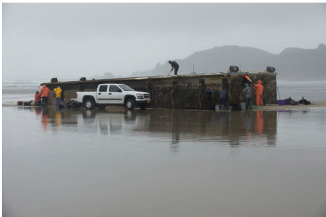
2012年6月に米国オレゴン州の海岸に打ち上がった青森県三沢市の漁港の浮き桟橋 Misawa dock landing in Oregon beach in June 2012

North Pacific Marine Science Organization (PICES)