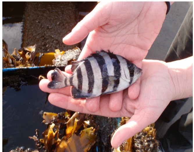
アメリカ西海岸に漂着した船から見付かったイシダイ Striped Beakfish found in a boat landing in North America

しかし、評価対象となった大部分の生物種は、「低い」～「中くらい」のリスクを有しているだけだと考えられました。このような評価結果となった原因の一部は、他の地域における移入の記録やその影響に関する情報が不足しているためだからかも知れません。北カリフォルニア生態区分は最も高い移入リスクをかかえています。一方、アラスカ湾はその気候区分の違いから、最も低いリスクしか受けないだろうという結果になりました。以上の評価結果は、関係者や一般市民の方に漂流物による生物侵入に注意を振り向けると共に生物相のモニタリング調査にとって役に立つ情報を与えるものと考えています。