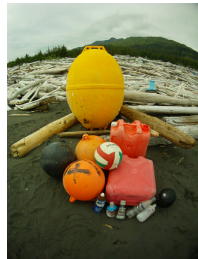
アラスカ州モンタギュー島で 収集した日本製品の漂着物 Marine debris of Japanese products from Montague Island beach, Alaska