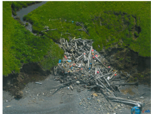
北米西海岸に打ち上げられた海洋漂着物 Marine debris accumulation in west coast of North America

2011年東日本大震災により発生した津波により、未曾有の莫大な量の漂流物が太平洋に流出した。津波数ヶ月後に、これらの海洋漂流物の北米海岸への影響に対する懸念が広まっていった。米国の連邦と州政府、地方自治体、および非政府組織と学術機関は共に、漂流物の漂着による脆弱な生態系におよぼす影響を制限するべく共に歩み寄っていった。漂流物の発見、漂流予測のためのモデル・シミュレーション、モニタリング、対策の立案、漂着物の撤去、情報交換に精力的に取り組んだ。これらの一連の活動は、日本政府からの寛大な予算的措置により大きな支援を受けた。「海洋ゴミのモニタリングと影響評価プロジェクト」は、海岸に存在する海洋ゴミの量とタイプを報告するための全米におけるパートナーとボランティアが参加する市民によるモニタリング戦略の一つである。大震災後の2012年3月から2016年2月までの4年以上に渡る調査により、全部で211,709個もの漂着物が合衆国の太平洋海岸線上の91箇所で記録された。航空観測をアラスカ州とハワイ、カナダのブリティッシュ・コロンビア州で実施し、海岸に蓄積されていた漂着物を発見し、漂着物の影響を最小限にとどめるために清掃活動を行うための場所を見付けるために活用された。