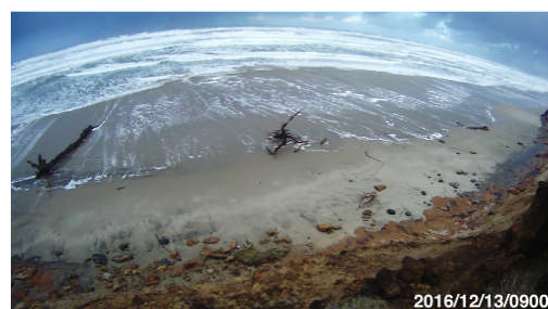
ウェブカメラが捉えた嵐の前後の漂流物の増減

Debris dynamics captured by webcam before and after storm