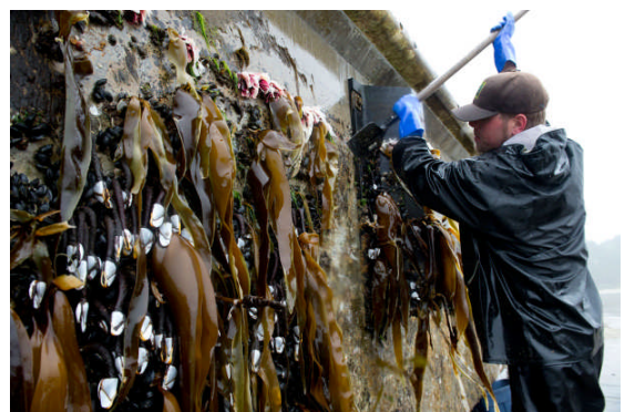
オレゴン州の海岸に漂着した浮き桟橋に付着していた海藻

2011年に生じた大津波による海洋漂流物は移入種導入の可能性をもたらした。私達は日本の津波による海洋漂流物と他の海洋生物の運び屋とを比較しつつ、リスク評価を行った。北太平洋におけるこれまでに良く知られた移入種の7つの運び屋として、養殖、船舶のバラスト水と船体付着、レクリエーション用ボート、海産物や観賞用生物の貿易、釣り餌が挙げられる。これらの「運び屋」は移入の過程に応じて8つの要素により比較評価した。この要素には、運び屋への付着、運び屋担体当たりの種と生息数の多さ、運び屋担体の個数、生存可能性、運ばれている期間の長さ、環境への放出、放出された環境との適合性が含まれる。津波漂流物は、運び屋としての個数の多さ、環境への付着生物の放出という二つの要素において高リスクと判定された。他の要素については低・中程度と判定された。評価対象となった他の運び屋にはもっと高いリスクを示したものがあつた。これまで私達の調査では、北米とハワイにおいて津波漂流物から見付かった生き物の移入は見られていない。多くの津波漂着物に付着していた生物種は、少なくとも一つの北西太平洋の生態域（エコリージョン）で震災以前に見付かっており、また既に他の運び屋に付着していることが知られている種と重複している。以上の比較から、津波漂流物は比較的 low risk の運び屋であると結論付けた。一方、津波で漂流物が流出したことに起因する生物種の移入の可能性は残されているが、他の運び屋も北西太平洋域で移動し続けており、津波漂流物以外の多くの手段による生物種の移入を除いて津波漂流物に由来する生物種の将来の移入を見極めるのは非常に困難であると考えられる。