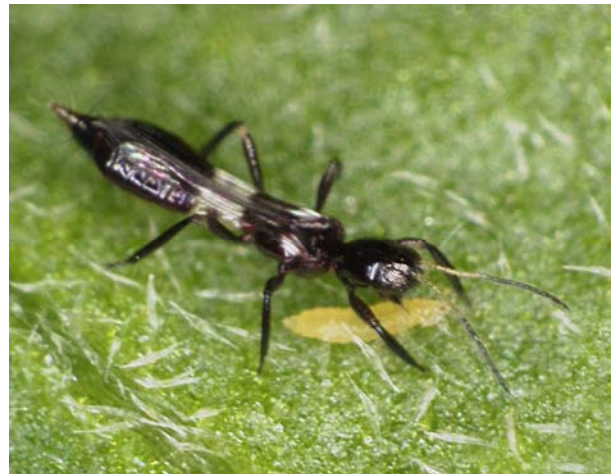
害虫となるアザミウマ幼虫を捕食中のアリガタシマアザミウマ成虫