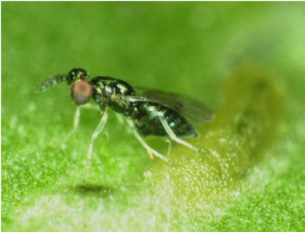
ハモグリミドリヒメコバチ成虫