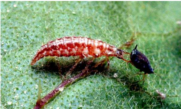
アブラムシを捕食中のヤマトクサカゲロウ幼虫