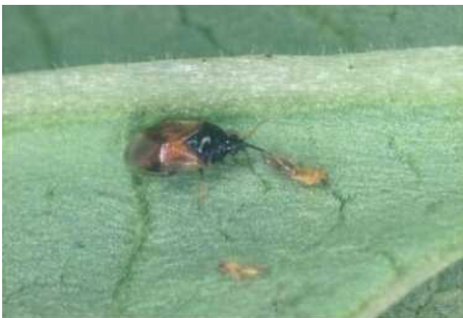
アザミウマを攻撃中の タイリクヒメハナカメムシ成虫