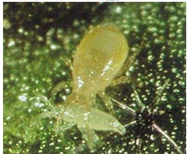
アザミウマ幼虫を捕食中の ククメリスカブリダニ幼虫