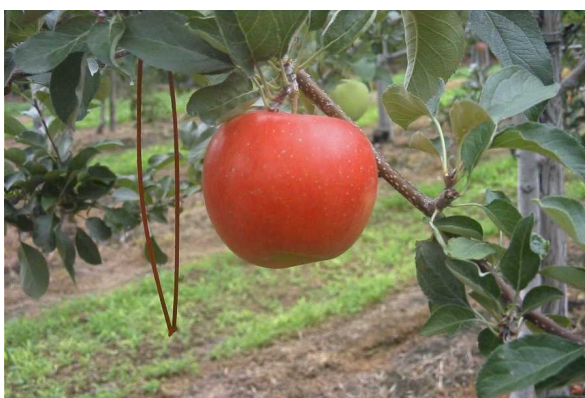
図 2 果樹での使用例

( http://www.aomori-itc.or.jp/assets/files/kajuken/H20nasionkonR.pdf )