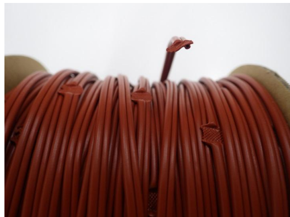
※長さ50m、太さ2.3mmのチューブと太さ1.0mmのアルミ線を並列に接合 図1：ダイシルアをエチレン酢酸樹脂チューブに封入したロープ状製剤