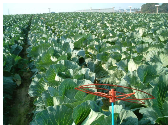
図 3 野菜での使用例

（図 2 及び 3：生物農薬+フェロモンガイドブック 2006 日本植物防疫協会）