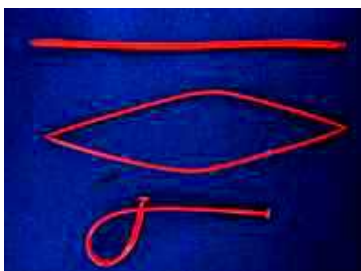
長さ 20cm、太さ 2mm のチューブ 2 本を両端で接合している

樹木等には農薬（交信かく乱剤）を封入したポリエチレンチューブがつり下げられ（図 1）、ポリエチレンチューブ内から大気中に放出される。通常 10a あたり 100～200 本程度をほ場内の樹木（果樹）につり下げたりほ場内に立てた支持棒に巻きつけて使用する（図 2 及び 3）。