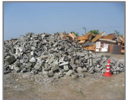
仮置状況(コンクリートブロック)