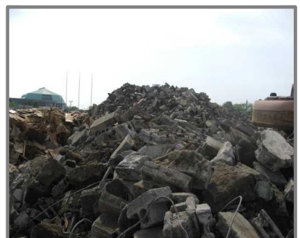
仮置状況(コンクリートブロック)