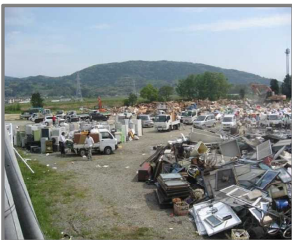
益城町仮置場(全景)