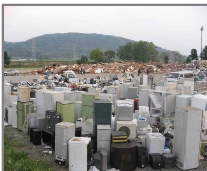
仮置状況(家電4品目)