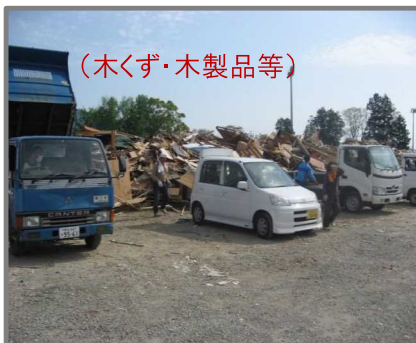
住民による仮置場への搬入状況