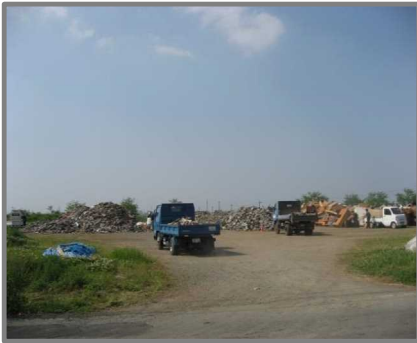
嘉島町仮置場(全景)