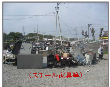
仮置状況(金属製品)