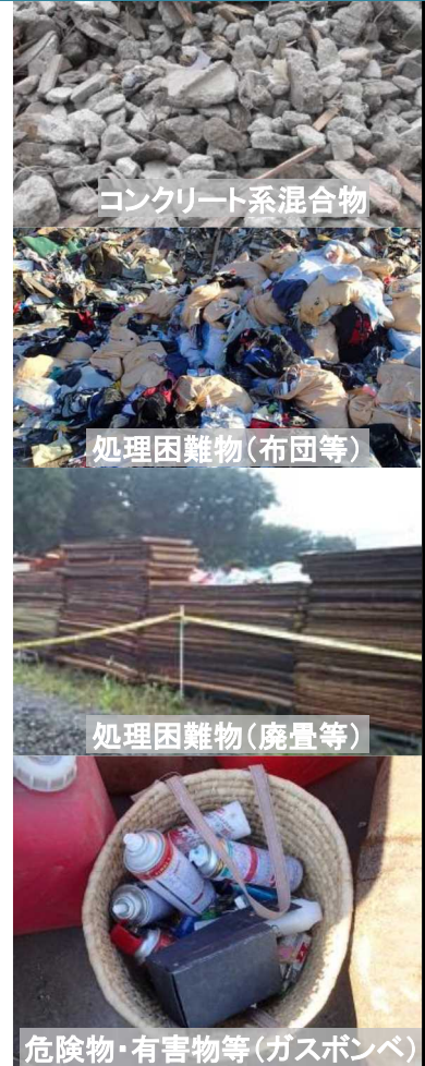
コンクリート系混合物