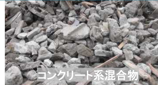
コンクリート系混合物