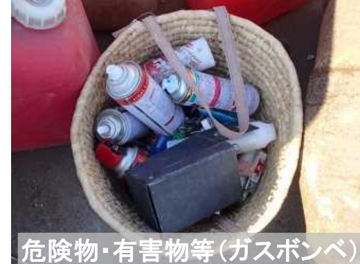
危険物・有害物等(ガスボンベ)