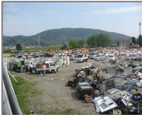
益城町仮置場(全景)