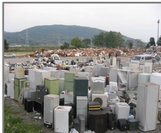
仮置状況(家電4品目)