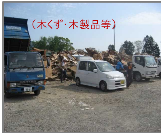
住民による仮置場への搬入状況