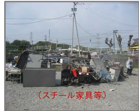
仮置状況(金属製品)