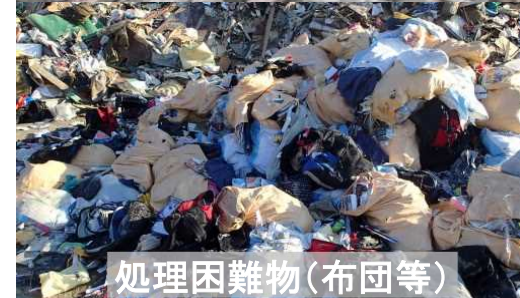
処理困難物(布団等)