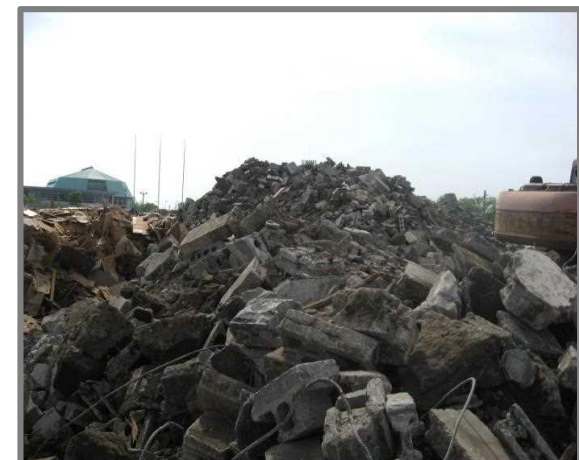
仮置状況(コンクリートブロック)