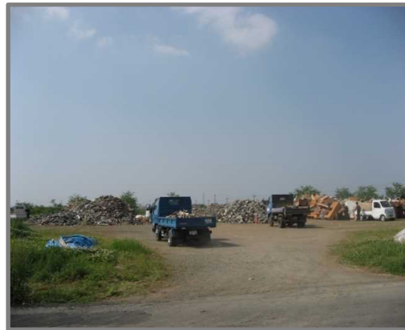
嘉島町仮置場(全景)