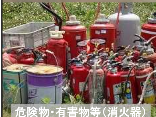
危険物・有害物等(消火器)