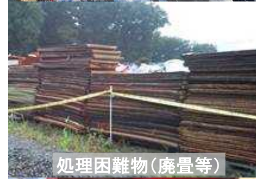
処理困難物(廃畳等)