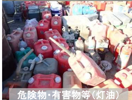
危険物・有害物等(灯油)