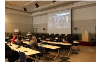
セミナー終了後、東日本大震災における災害廃棄物処理の取組のビデオを放映。