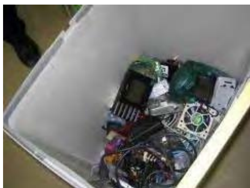
ホームセンター1店舗からの回収物（回収期間：2週間） ボックス回収計(30施設)では 約165kg回収