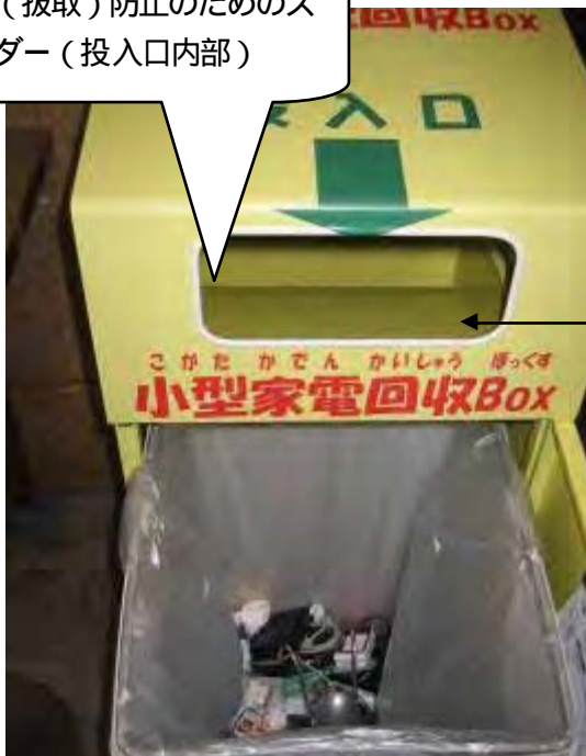
回収ボックス投入口付近