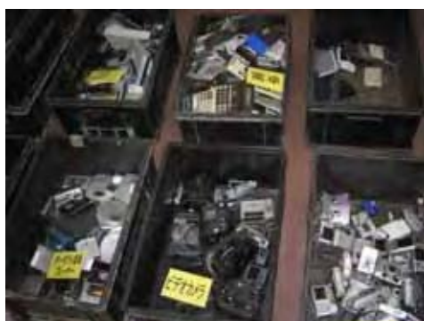
不燃物からのピックアップ物 13種類に分別 回収量 約282キロ (回収期間 約1ヶ月半)