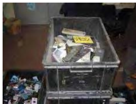
分別後の使用済み小型家電 リモコン類