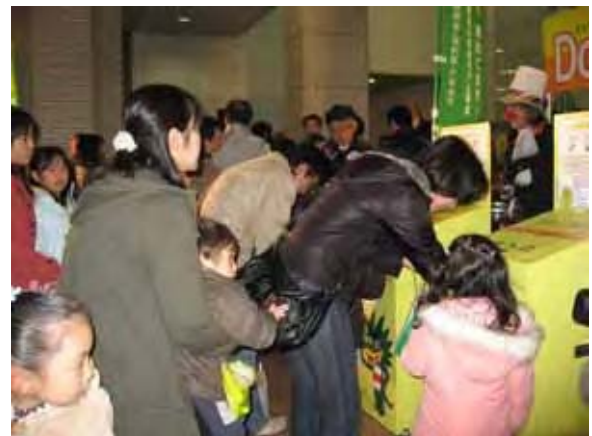
オープニングイベント 投入の開始