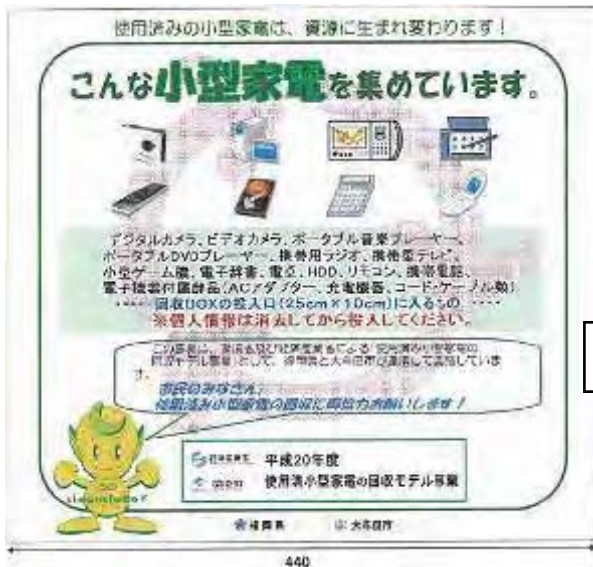
回収ボックスの背板