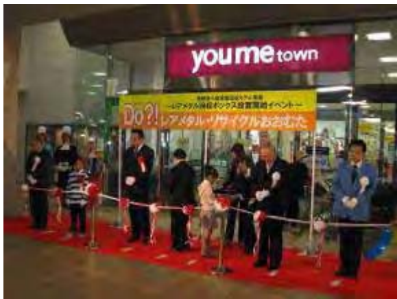
オープニングイベント （平成 21 年 1 月 18 日）

デジタルカメラ、ビデオカメラ、ポータブル音楽プレーヤー、ポータブル DVD プレーヤー、携帯用ラジオ、携帯用テレビ、小型ゲーム機、電子辞書、電卓、HDD、リモコン、携帯電話、電子機器付属品（AC アダプター、充電機器、コードケーブル類）等