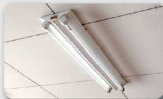
業務用・施設用蛍光灯の安定器