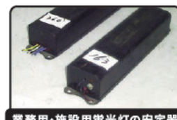
業務用・施設用蛍光灯の安定器