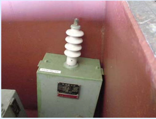
サージアブソーバ (避雷器)

主回路と大地間に常時接続し、電気機器に有害なサージ(過電圧)を大地へ放出するためのもので、コンデンサの一種