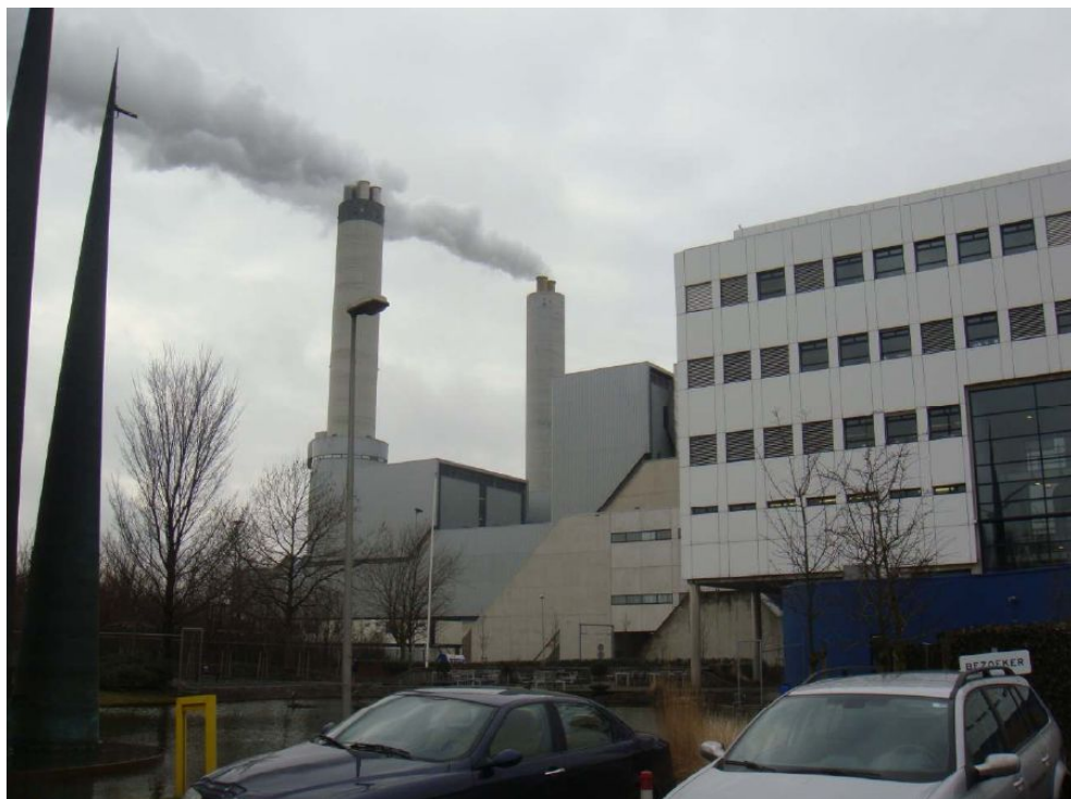
阿姆斯特丹市 AEB しおりと施設外観

Het AEB staat bij de verwerking van afval voor een gezond en schoon milieu: de schoorsteen en witte rook zijn daar het symbool van. Het schone milieu is zichtbaar in de "bovenwereld". Het afvalverwerkingsproces vindt plaats in de "benedenwereld". De koeien in het landschap staan voor leven en zijn hier de ambassadeurs van de voedselketen. Daarmee wordt de CO 2 -kringloop met een kwinkslag verteld, en is de kern en de missie van het AEB in beeld gebracht.