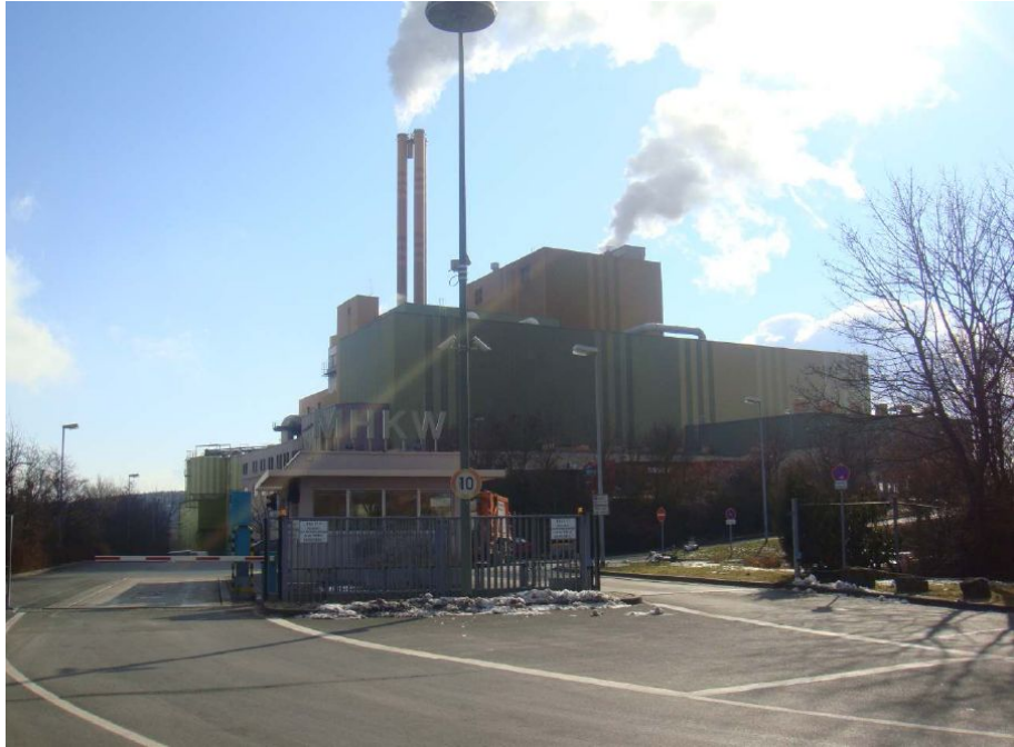
ヴェルツブルグ市MHKW 施設外観