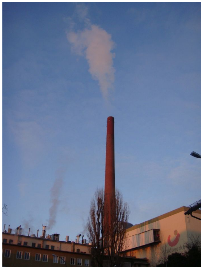
ローゼンハイム市MHKW 施設外観