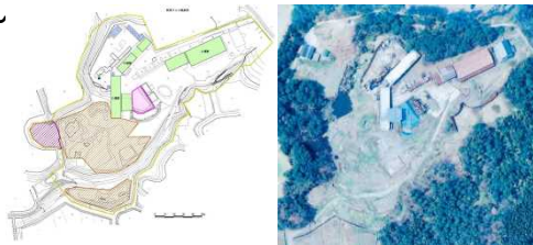
<不適正処理現場> 敷地面積:約2.3万m 2 投棄量 :約2.6万m 3

①特別管理産業廃棄物を含む廃液等が公共用水域に流出するおそれ ②可燃性廃油が落雷等により出火し、火災により廃棄物の飛散流出及び有毒ガスが発生するおそれ ③埋設された燃え殻等が崩落して飛散流出し、公共用水域及び大気中に拡散するおそれ ④地上堆積及び埋設された燃え殻等が飛散流出し、公共用水域及び大気中に拡散するおそれ