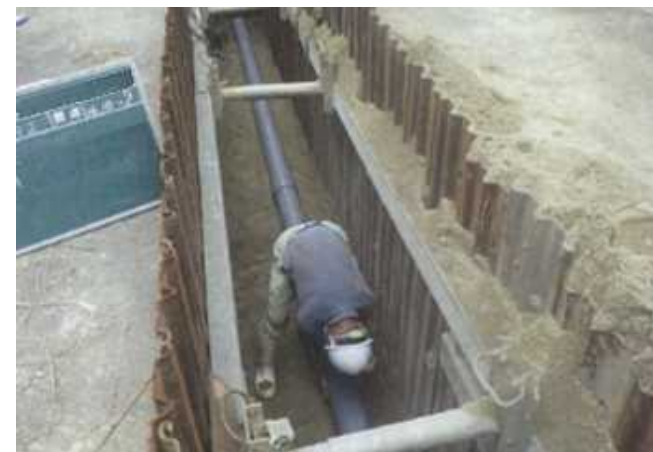
下水道管渠の布設（整備）状況