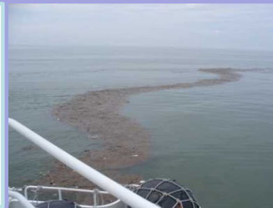
海面上に集まる漂流ごみ