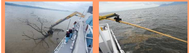
7月に発生した九州北部豪雨後の漂流ごみ回収状況