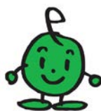
こどもエコクラブ