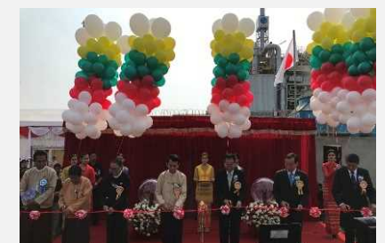
廃棄物発電 (ミャンマー連邦共和国)