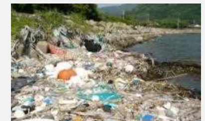
海岸に流れ着く漂着ごみの様子