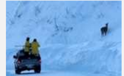
効果的なシカ捕獲事例