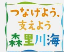
自然の恵みを引き出すライフスタイルへの転換を目指す