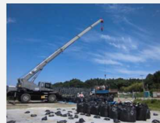
除去土壌等の搬出の様子