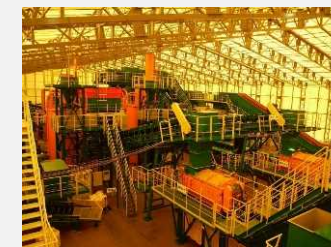
除去土壌等の受入・分別施設