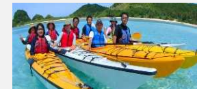
国立公園の魅力向上の推進