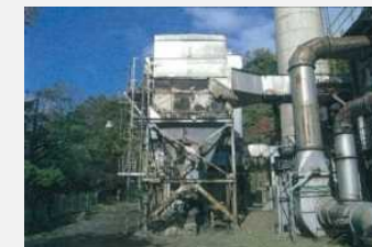
老朽化した廃棄物処理施設の更新