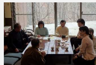
暮らしと放射線に関する住民の意見交換