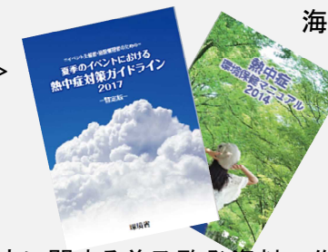
熱中症に関する普及啓発資料の作成・配付