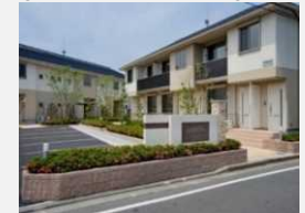
ネット・ゼロ・エネルギー・ハウス(ZEH)の新築・改修支援