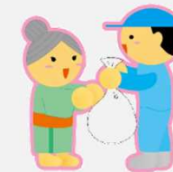
高齢化社会に対応した廃棄物処理体制の検討