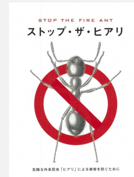
ヒアリの防除等に向けた情報提供