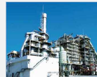
日本の技術を活用して建設された産業廃棄物焼却施設(台湾)