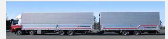
連結トラック導入により輸送の効率化を実現