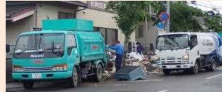
▲固形一般廃棄物業界からの収集・運搬の応援