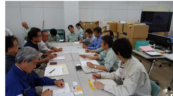
現地支援チームによる福岡県朝倉市への技術的助言