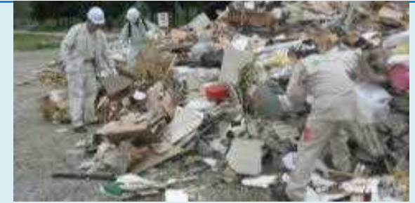
▲一次仮置場で分別を指導する環境省職員

→前震発生の翌日(4月15日)から環境省職員を現地(災害対策本部、熊本県、熊本市、益城町、大分県、福岡県)へ派遣し、情報収集や被災自治体への助言・指導を実施