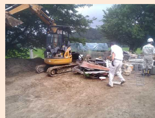
自主的に集積された災害廃棄物 （7月12日撮影）