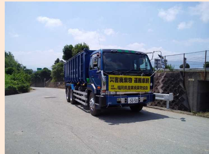
朝倉市から北九州市へ災害廃棄物を運搬する車両