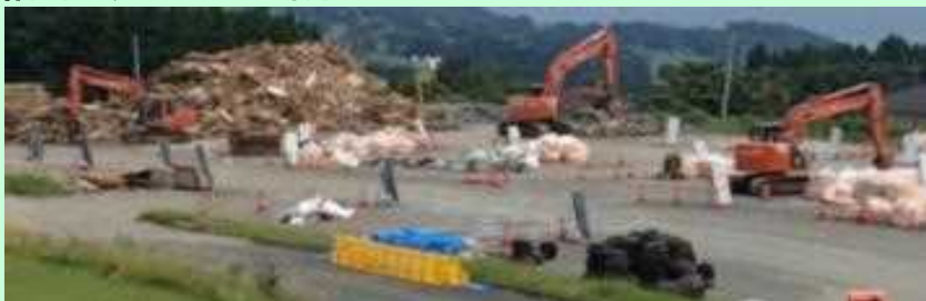
▲二次仮置場の様子