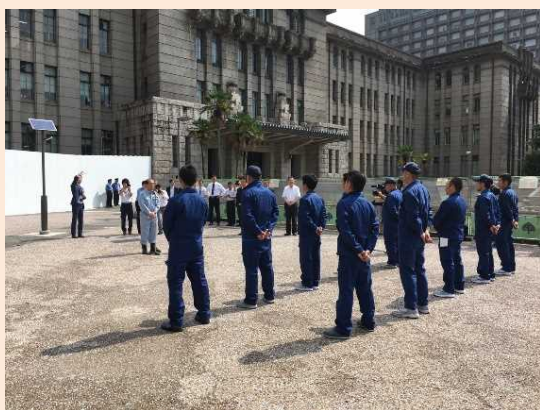
京都市の出発式（7月19日撮影）