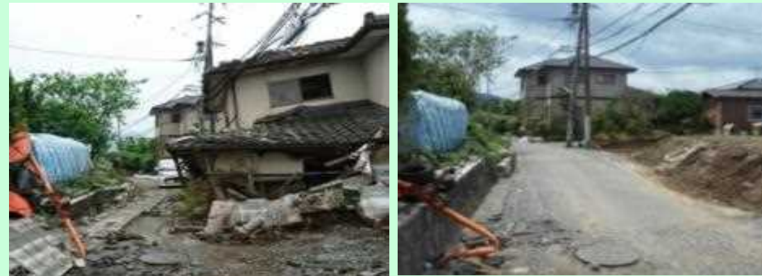
▲倒壊した家屋の解体・撤去の様子 (左)撤去前(右)撤去後