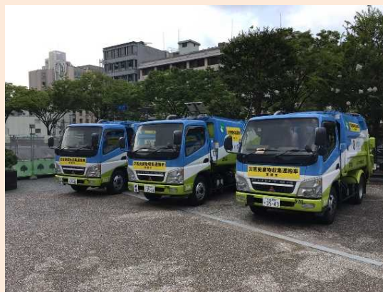
京都市の応援車両（7月19日撮影）