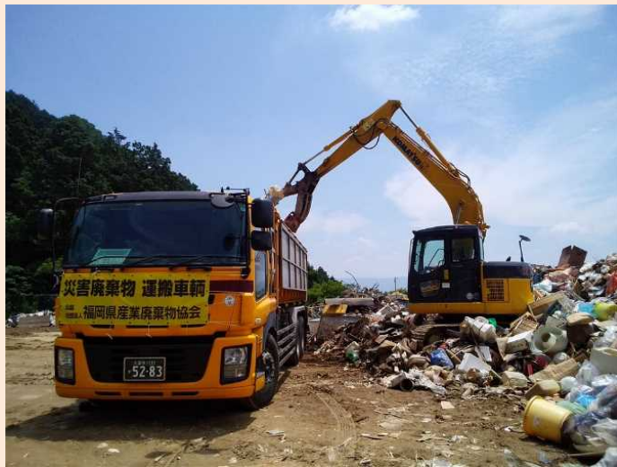
朝倉市から福岡市へ災害廃棄物を運搬する車両への積み込み状況