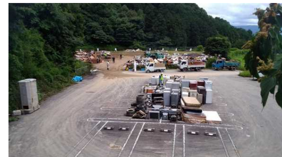
災害廃棄物の仮置場設置状況（福岡県朝倉市 7月9日時点）