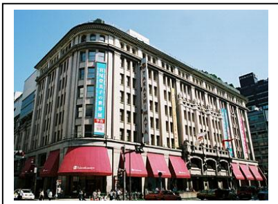
日本橋タカシマヤ (東京都中央区日本橋 2-4-1)