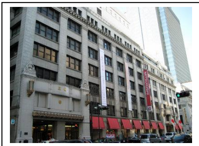
日本橋三越本店 (東京都中央区日本橋室町 1-4-1)