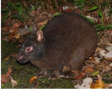
アマミノクロウサギ

推薦地は、イリオモテヤマネコ、アマミノクロウサギ、ヤンバルクイナなど、IUCN のレッドリストの絶滅危惧種 95 種（そのうち 75 種は固有種）を含む陸生動植物の生息・生育地である。また、その地史を反映し遺存固有種と新固有種の多様な事例がみられ、世界的にみても生物多様性の生息域内保全にとって極めて重要な自然の生息・生育地を包含した地域となっている。