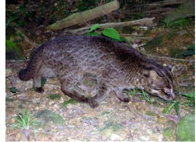
イリオモテヤマネコ