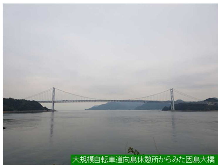
大規模自転車道向島休憩所からみた因島大橋