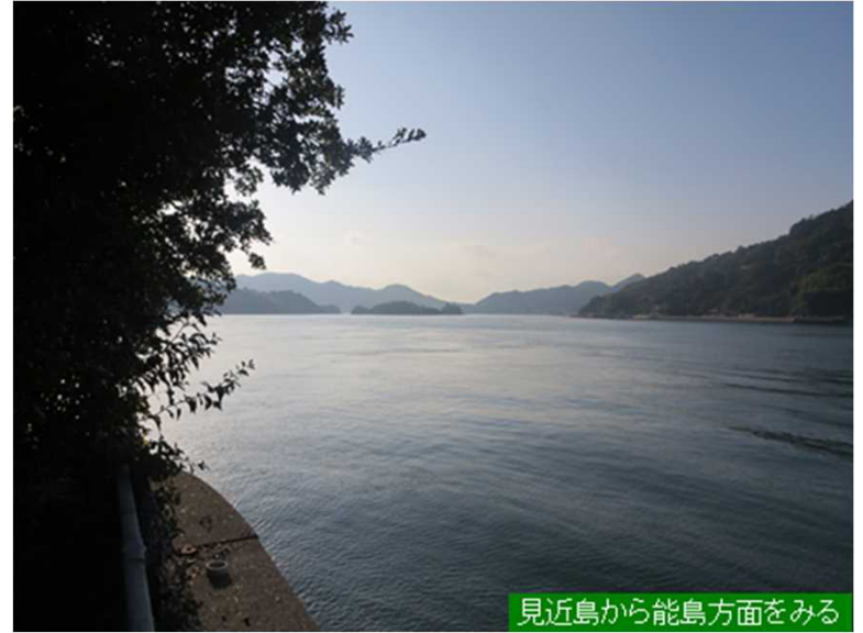
見近島から能島方面をみる