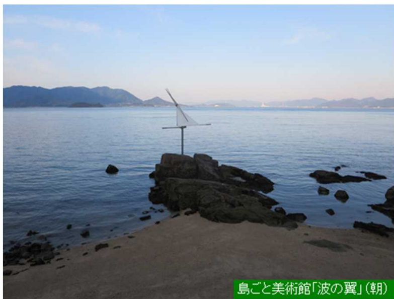
島ごと美術館「波の翼」(朝)