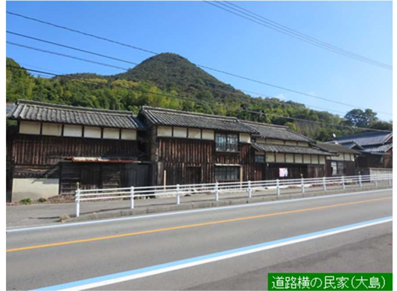
道路横の民家(大島)