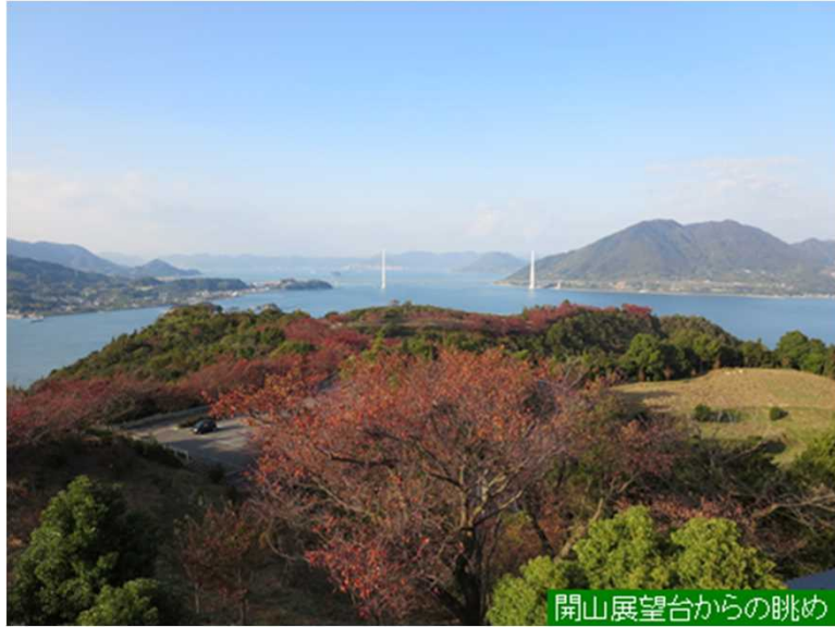
開山展望台からの眺め