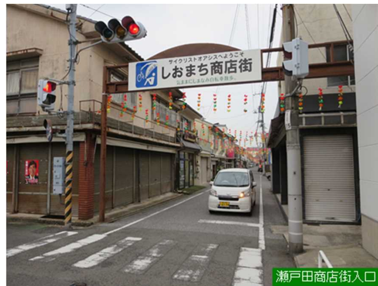
瀬戸田商店街入口