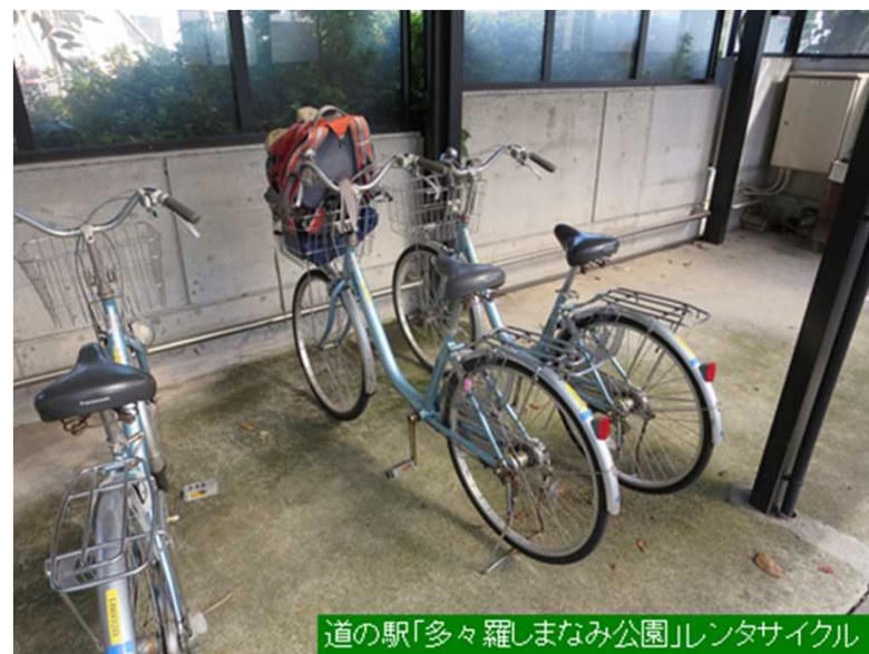
道の駅「多々羅しまなみ公園」レンタサイクル