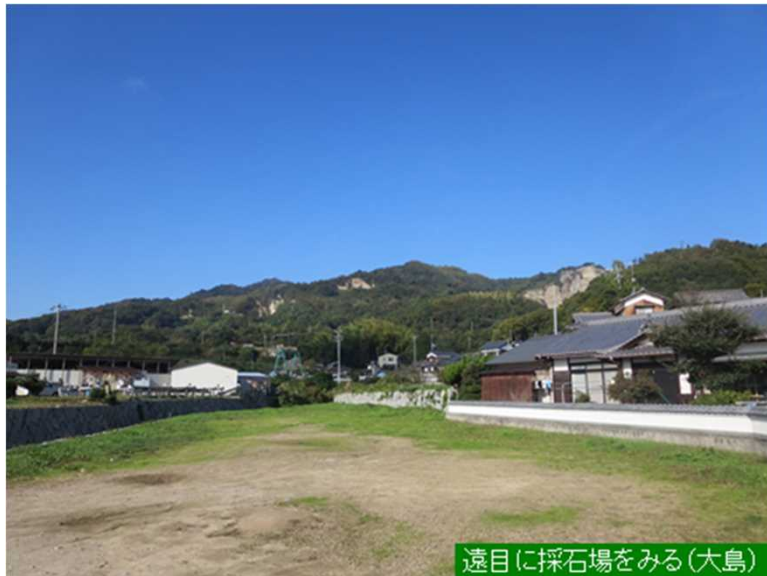
遠目に採石場をみる(大島)