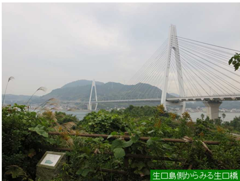
生口島側からみる生口橋