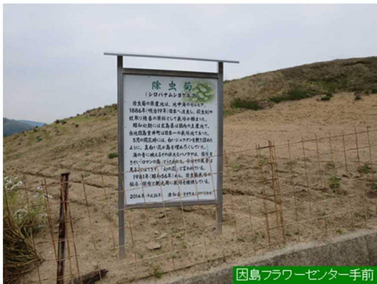
因島フラワーセンター手前