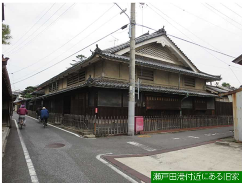
瀬戸田港付近にある旧家