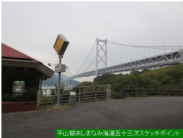
平山郁夫しまなみ海道五十三次スケッチポイント