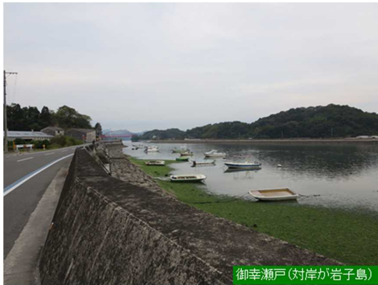
御幸瀬戸(対岸が岩子島)