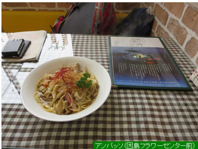
アンパッコ(因島フラワーセンター前)