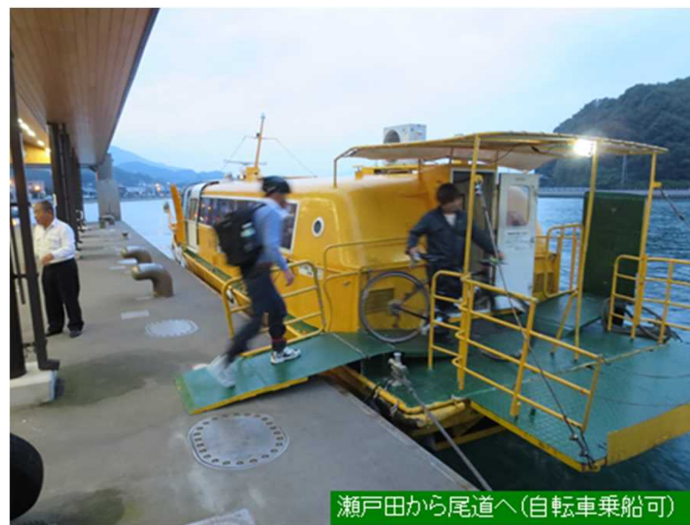
瀬戸田から尾道へ(自転車乗船可)