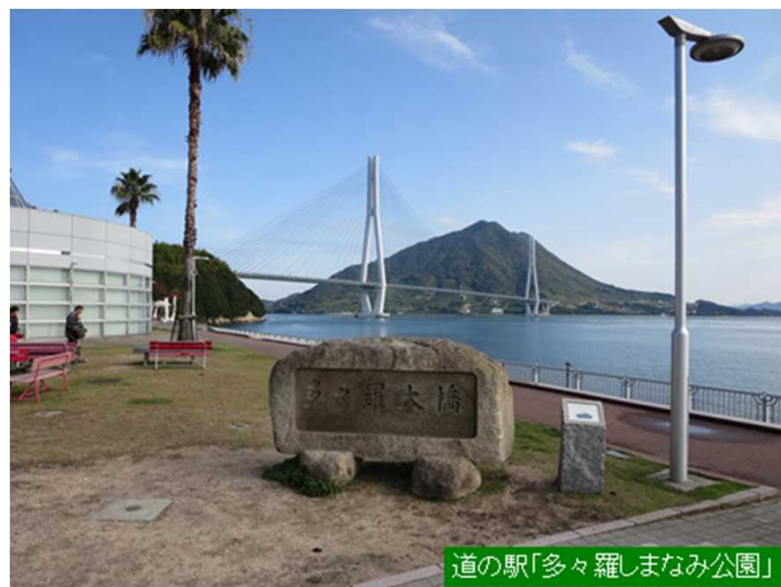
道の駅「多々羅しまなみ公園」