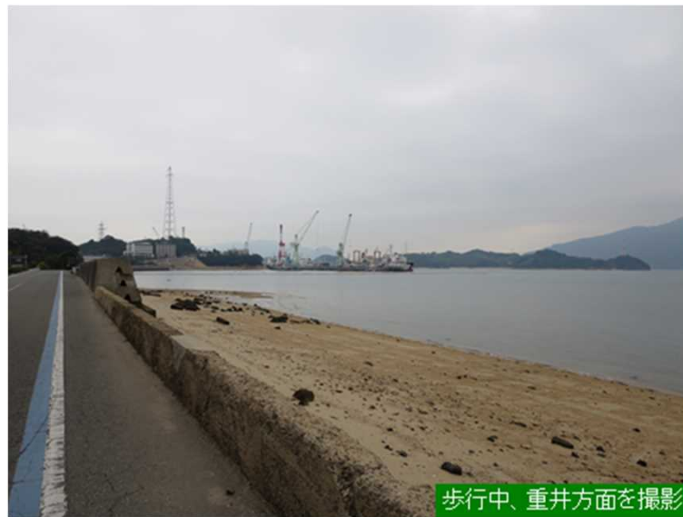
歩行中、重井方面を撮影