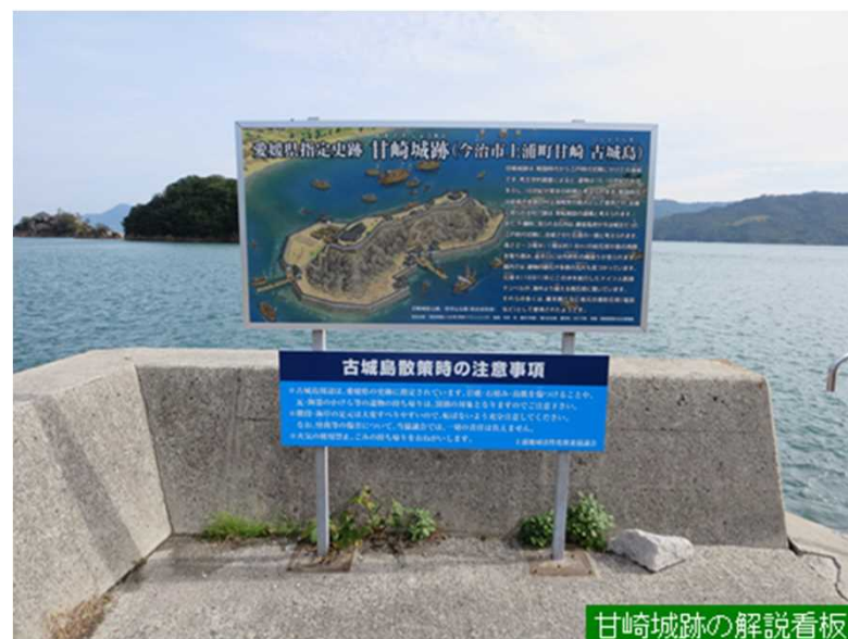
甘崎城跡の解説看板