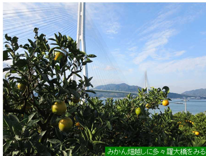
みかん畑越しに多々羅大橋をみる