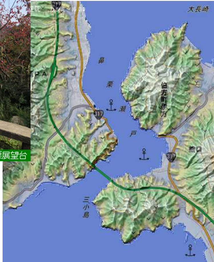
カシミール3Dで作成