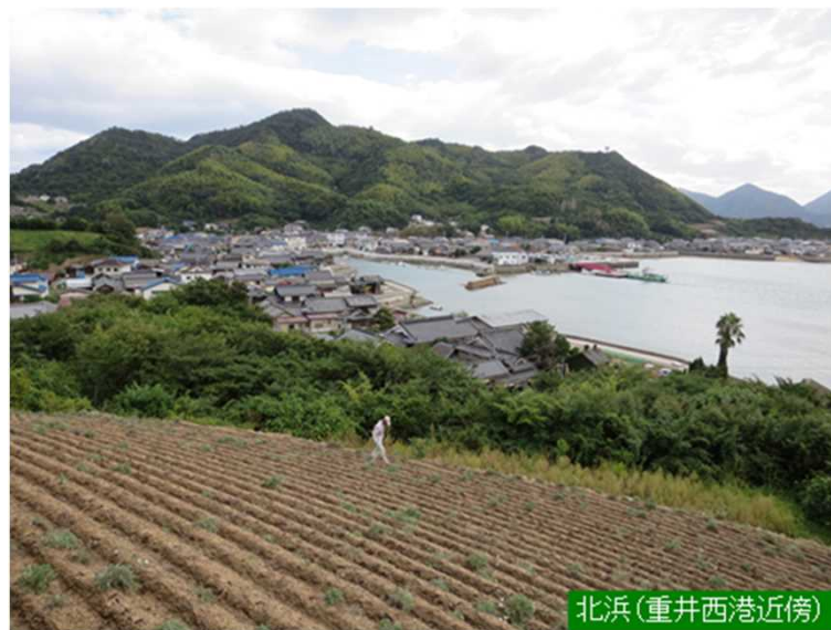
北浜(重井西港近傍)