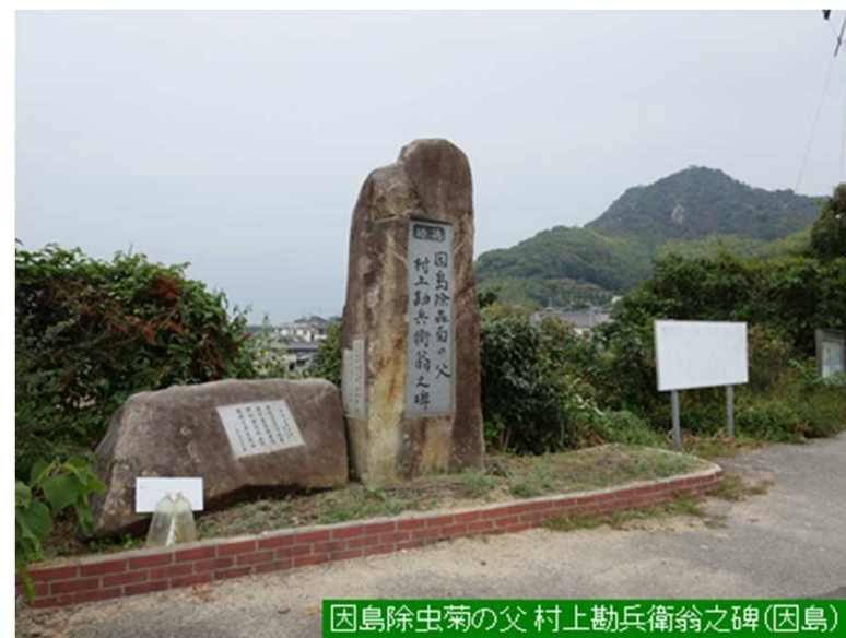
因島除虫菊の父 村上勘兵衛翁之碑(因島)