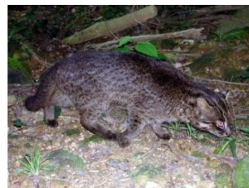
イリオモテヤマネコ