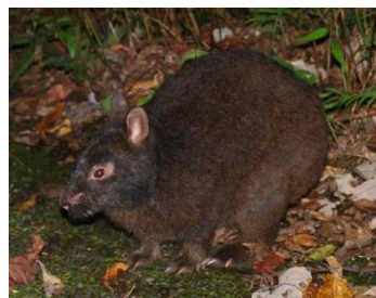
アマミノクロウサギ